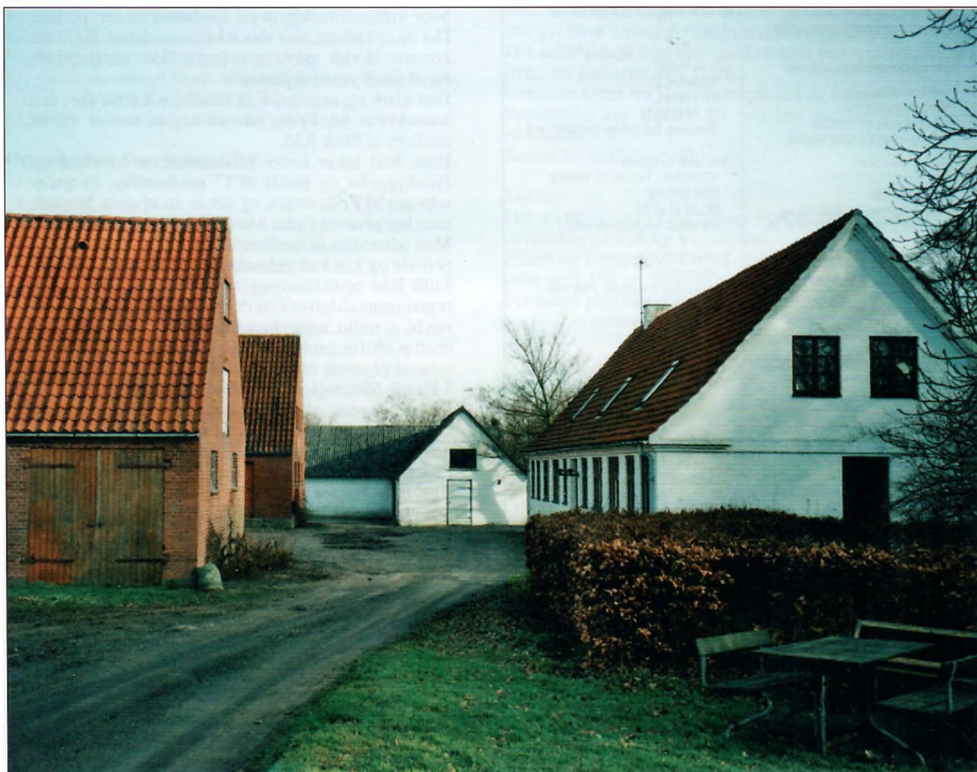
Råskovgård ved Hørve i Odsherred.