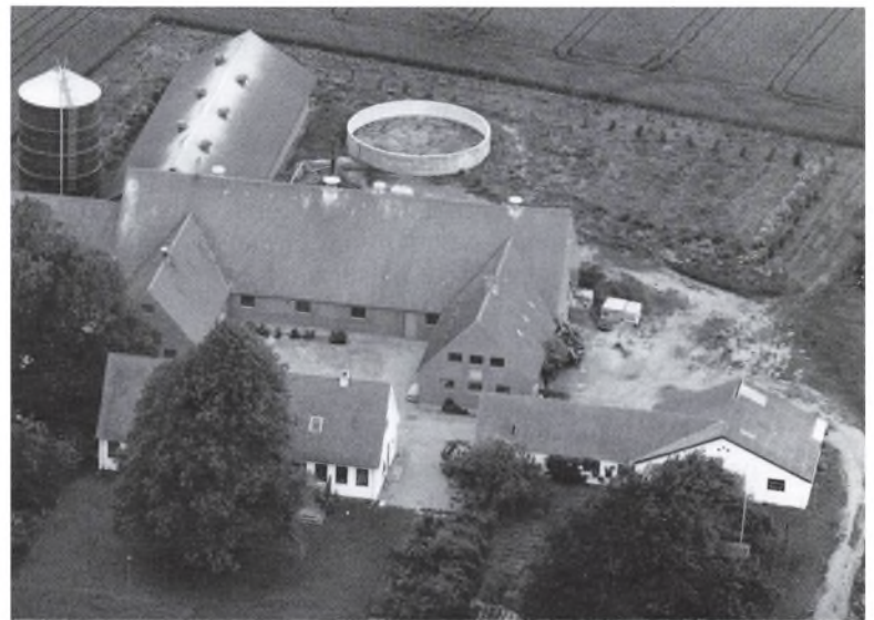
Råskovgård i dag.