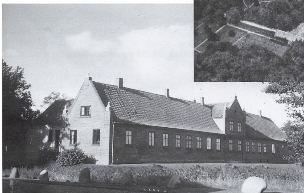
Volstrups hovedbygning set fra nord. Foto 1986.