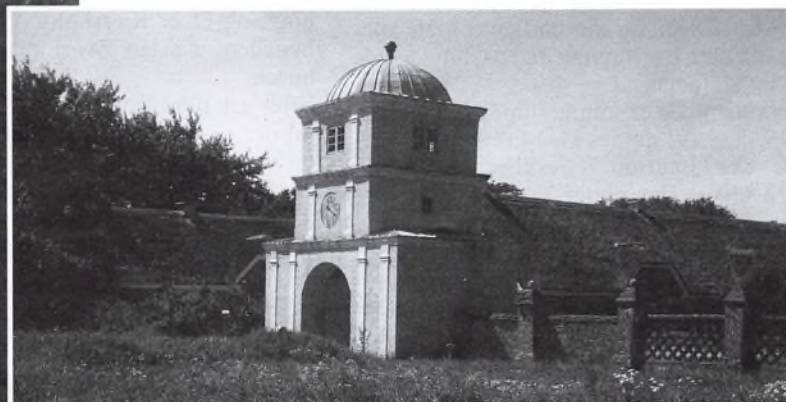
Nørre Vosborgs karakteristiske porttårn opført i 1790. Foto 1982.

Hovedbygningens sydøstlige hjørne. Tv. sydfløjen fra 1838 og th. østfløjen fra midten af 1500-tallet.