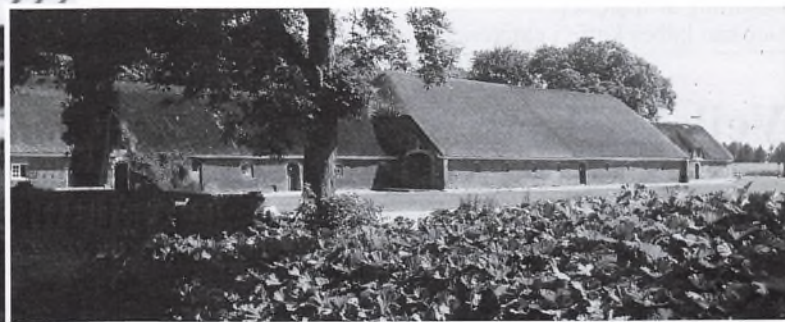
Den gamle ladegårdslænge fra 1780. Foto 1982.