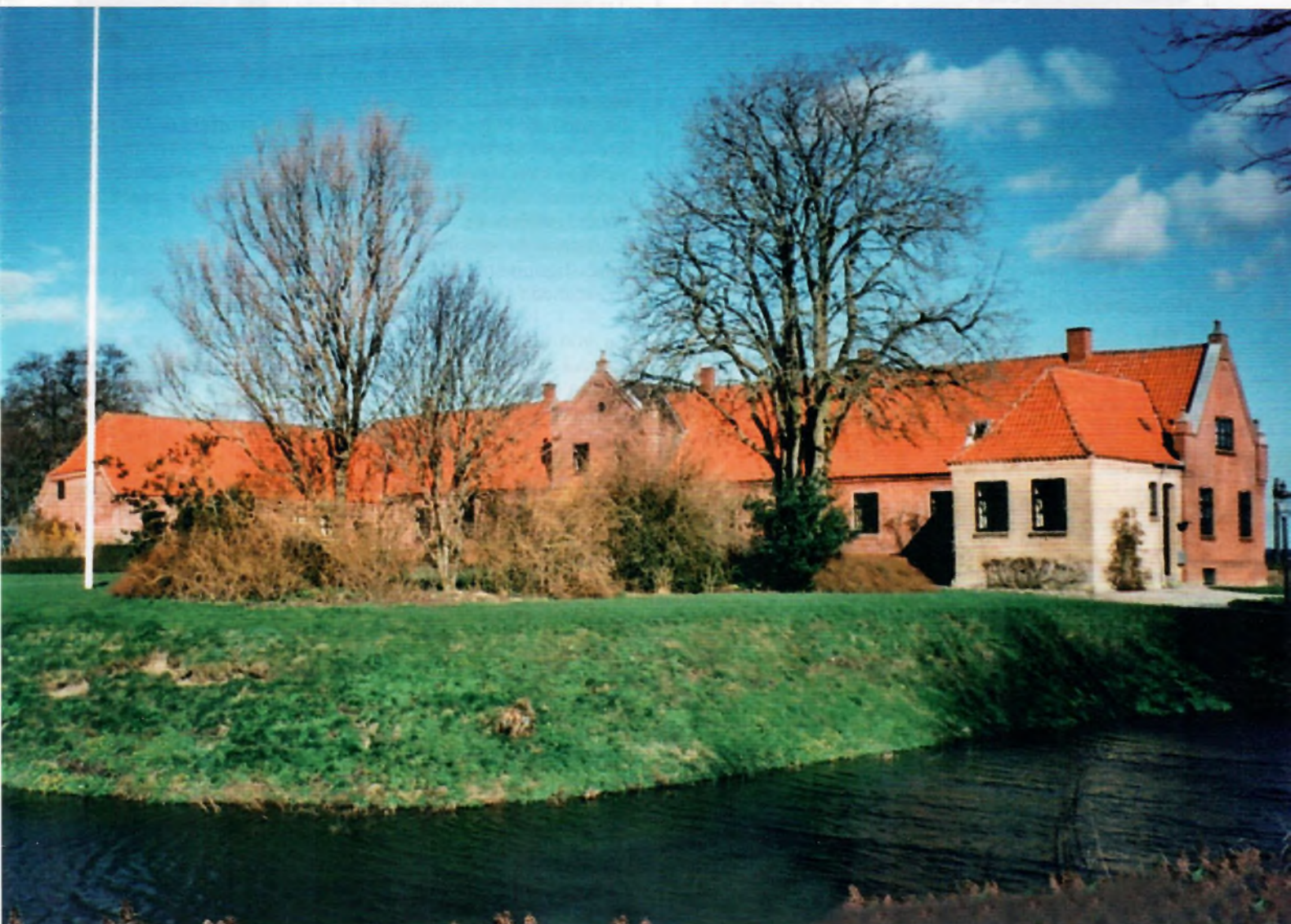
Volstrup ved Struer