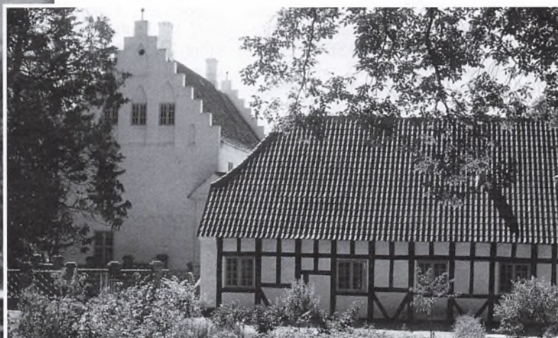
Nordfløjen fra 1640 og i baggrunden østfløjen. Foto 1982.