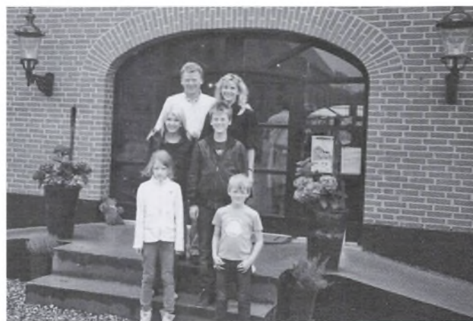
Familien på Hopballe Mølle foran indgangen til gårdbutikken.

”Det var et stort herskabeligt hjem. Foruden mølleriet var der landbrug og husdyrhold. Der var tre karle plus en ugift fodermester, og vi skulle være to tjenestepiger til at dele