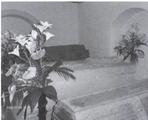
Kong Erik af Pommerens sarkofag i kirken i hans fødeby Darlowo.

I 1994 var der 125 ansatte nu er der 540, heraf er 48 fra dengang de var statsansatte, men de har formået at omstille sig. Vi begyndte i kantinen, hvor vi fik dagens ret – nakkekam med kartofler, sovs og salat. Et udmærket måltid.