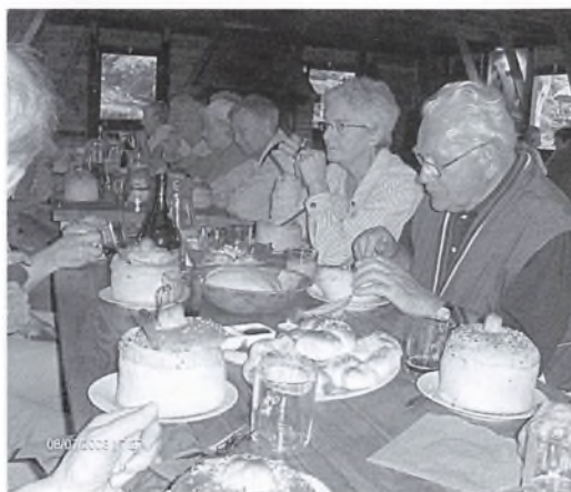
Restauranten, der serverede mad fra middelalderen, serverede suppen i et brød.

Tirsdag bød på et meget interessant besøg i Natos hovedkvarter i Szczecin. Efter at Polen var blevet medlem af Nato i 1999 flyttedes hovedkvarteret fra Rendsburg til Szczecin.