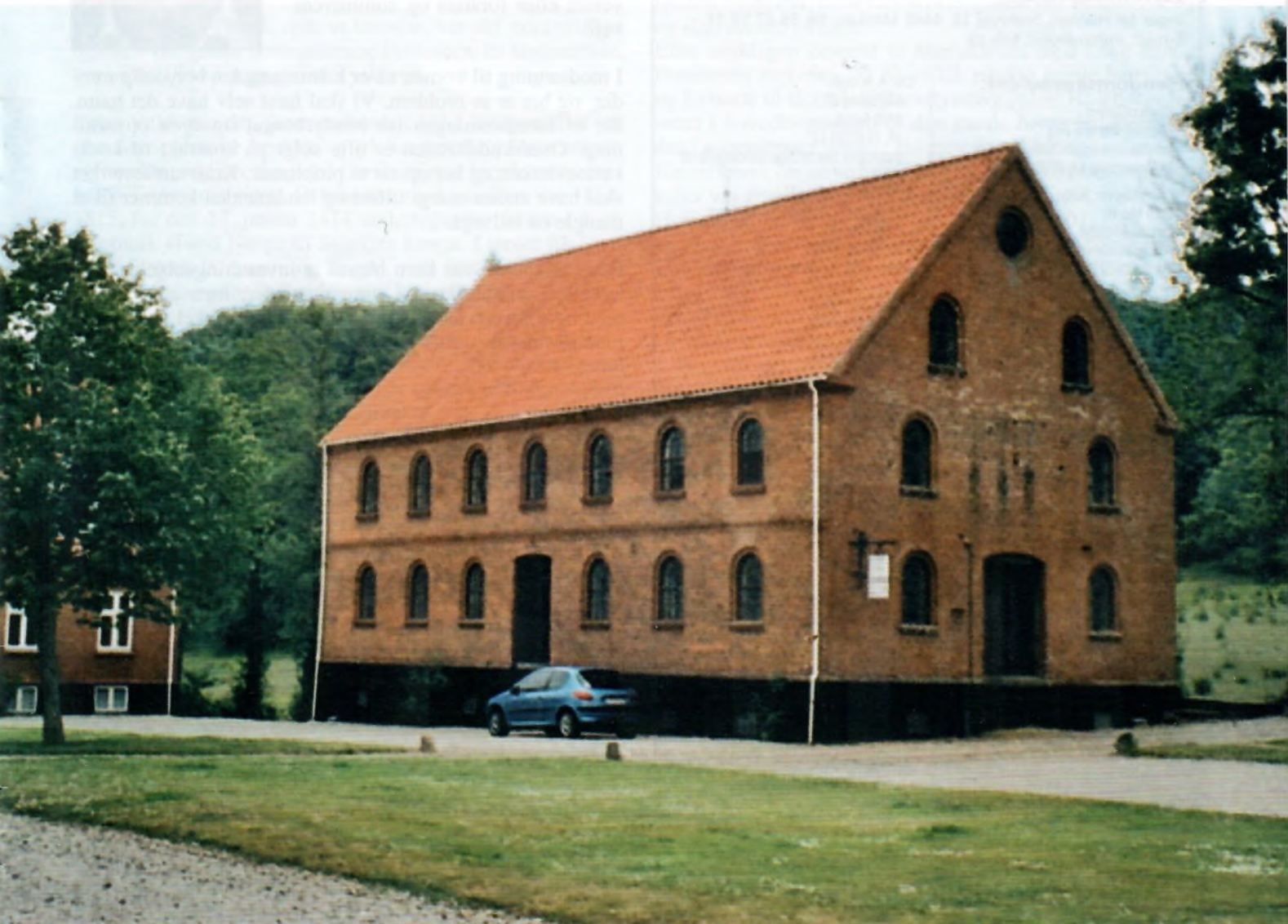
Høballe Mølle ved Jelling