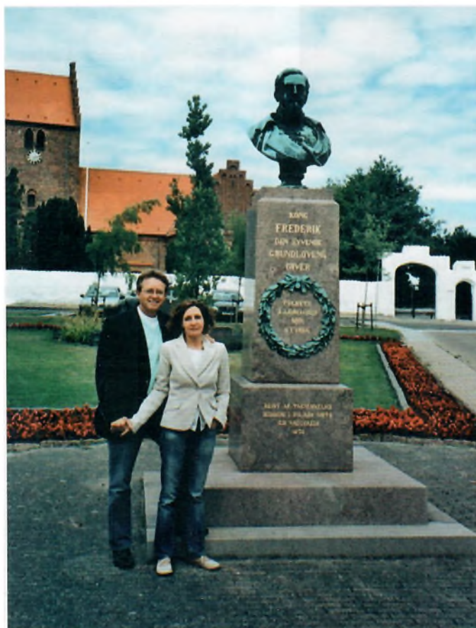
I 1872 rejstes en buste af kong Frederik den Syvende i Nykøbing Sjælland. Her er budskabet klart, for på stenen står: "Kong Frederik den Syvende – Grundlovens giver. Rejst af taknemmelige borgere i Holbæk Amts III valgkreds. 1872."