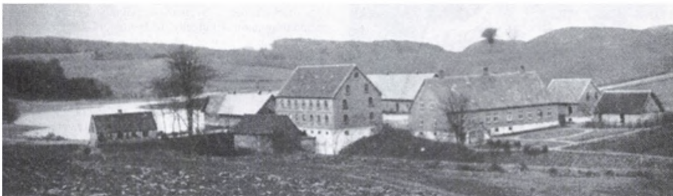
Hopballe mølle ca. 1905.

Hopballe Mølle ligger ved Grejsåen få kilometer fra Jelling. Her har været vandmølle i mere end 600 år. I Møllebogen, der blev udarbejdet på grundlag af Den store Hartkornsmatrikel af 1688, står Hopballe Mølle for 3½ td. hartkorn.