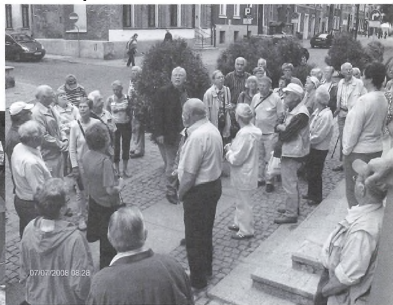
Fra byvandringen i den fredede by Torun.