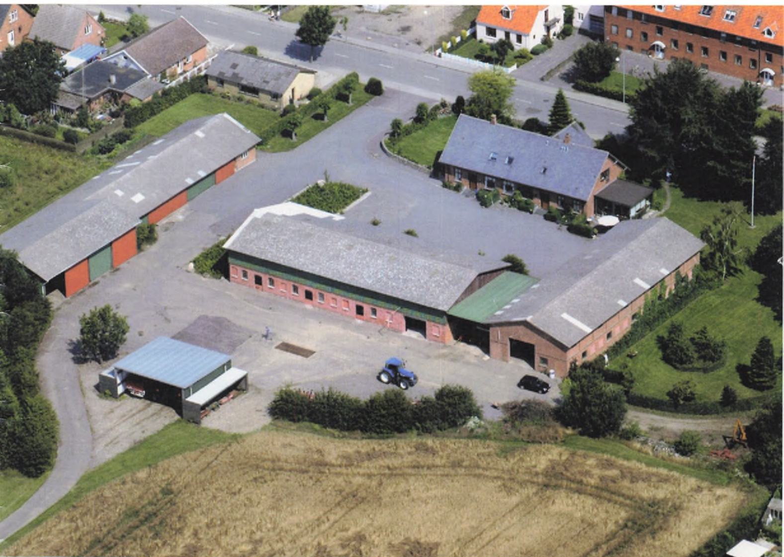
Annasminde ved Holeby