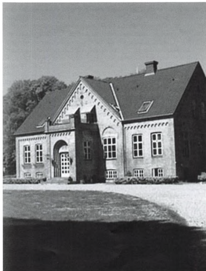
Hovedbygningen ligger midt i parken med en behagelig afstand fra avlsgården. Der er opført i 1876 i en afdæmpet gotisk stil med i store proportioner. Den brændte i 1879 og genopførtes. Hovedbygningen nedbrændte igen nytårmorgen 1979, da hele Sydolland var dækket med sne i et par meters højde. Hovedbygningen blev genopført i samme stil, som efter branden nøjagtig 100 år tidligere.