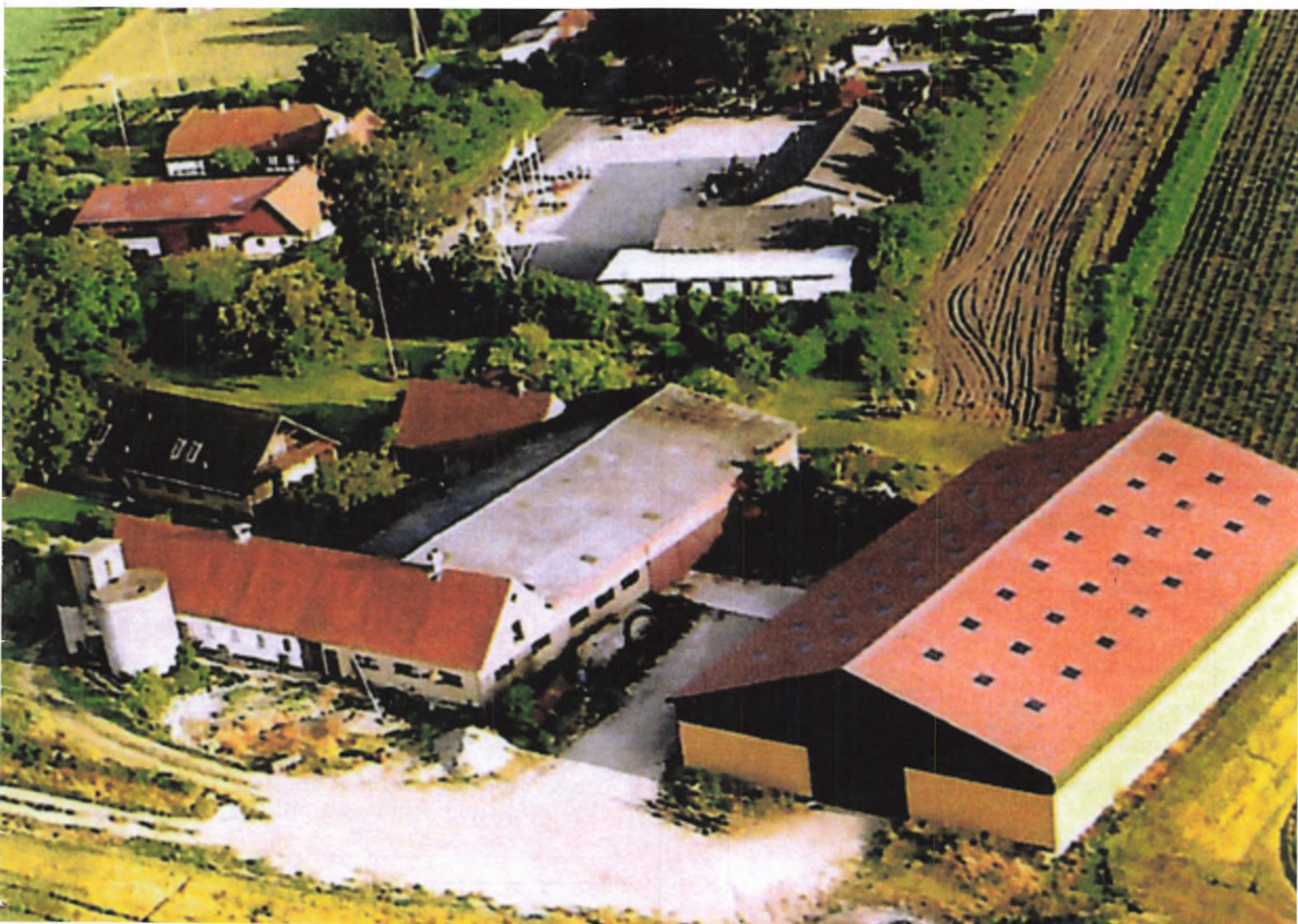
Dalbakkegård i Vester Ulslev på Lolland