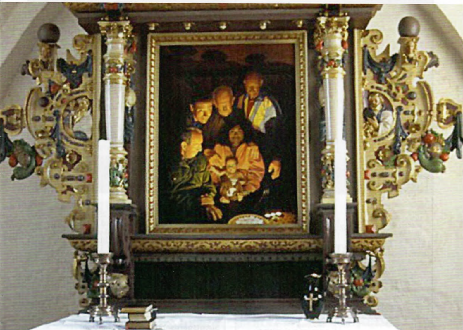
Alterbilledet i Maglebrænde kirke malet af Lars Physant