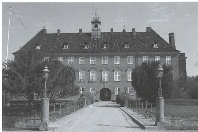
Vemmetofte i dag.

Efter prins Carls død i 1729 arvede prinsessen Vemmetofte og Højstrup, og takket være hendes overkammerherre Carl Adolf von Plessen, blev der efter hendes død i 1735 oprettet et adeligt frøkenkloster.