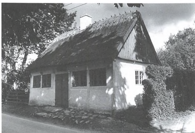
Prins Carls Skole.