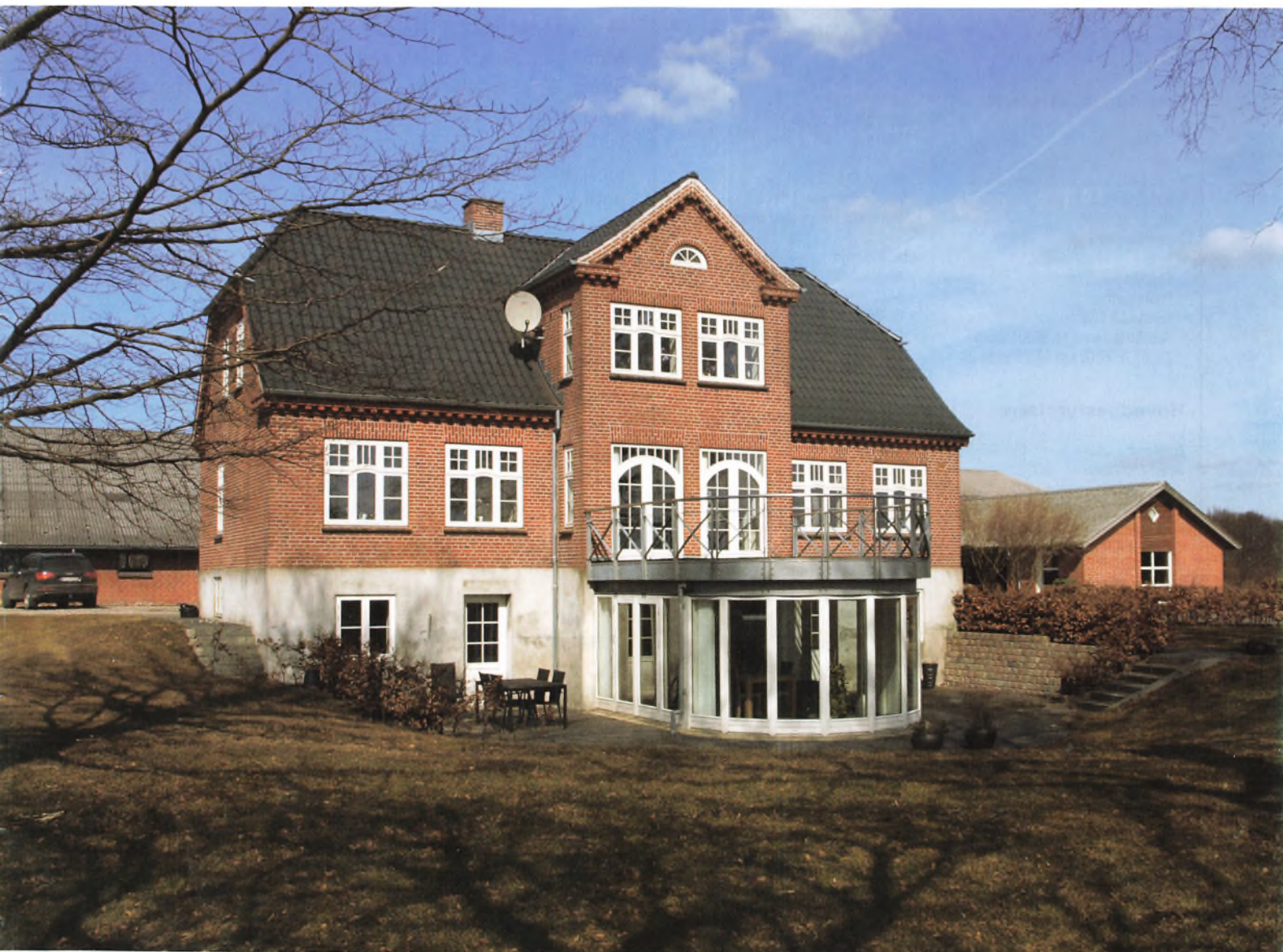
Mosevang ved Holsted