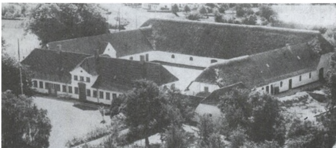
Østerbygård omkring 1960.