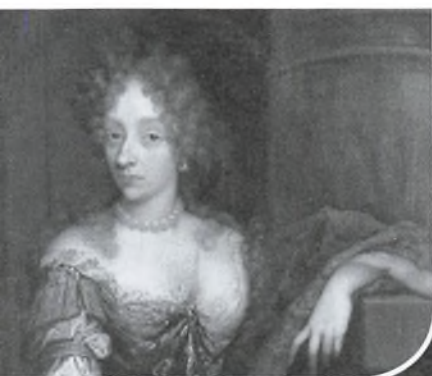
Dronning Charlotte Amalie, der fostrede tanken om et adeligt frøkenkloster på Vemmetofte.

I Esge Broks ridderskal, senere prins Carls forgemak og nu klosterets fruerstue lod Tyge Brahe og Berete Brok opsætte en prægtig kamin med deres våbener. Nedenunder ses Rosenkrantz og Krabbes våbener og midt på kaminens ses devisen: "Nulla calamitas solæ". Som bør oversættes: "I ulykken er man ikke alene".