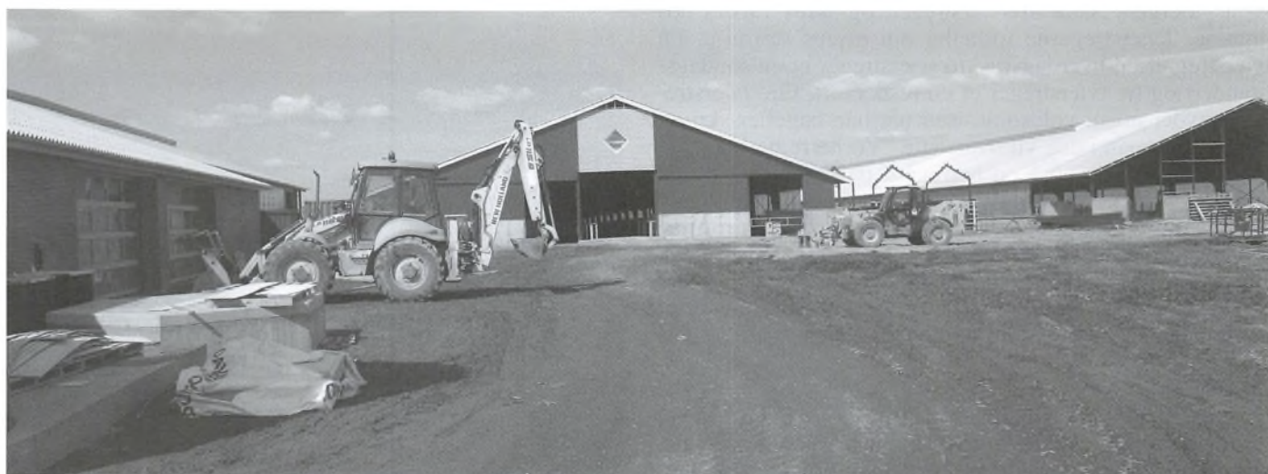
Det nye staldkompleks, der er opført på åben mark.