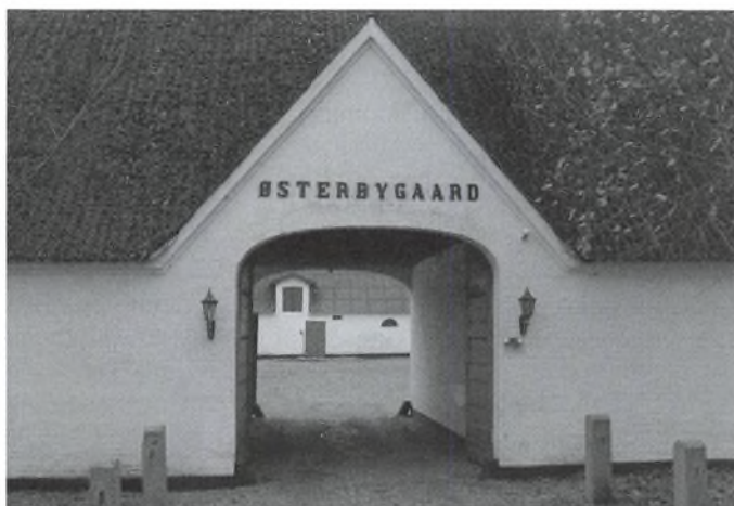
Porten i længen ud til vejen bærer i frontispicen gårdens navn.