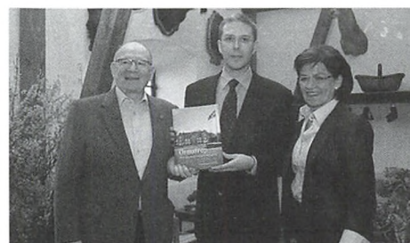
Bogens forfatter sammen med gårdens ejere.

Espen Kirkegaard Espensen: Ormstrup - Historien om en midtjysk herregård Udg. af Forlaget Skippershoved. 145 sider, ill., 198 kr.