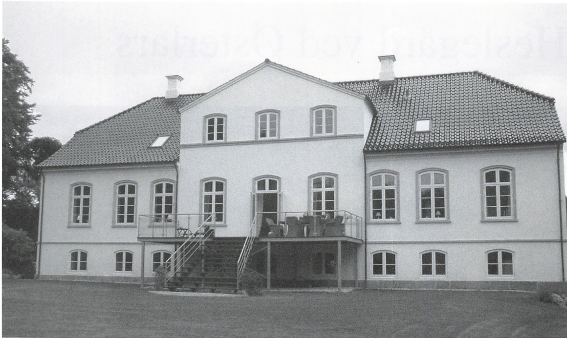
Hovedbygningen set fra haven.