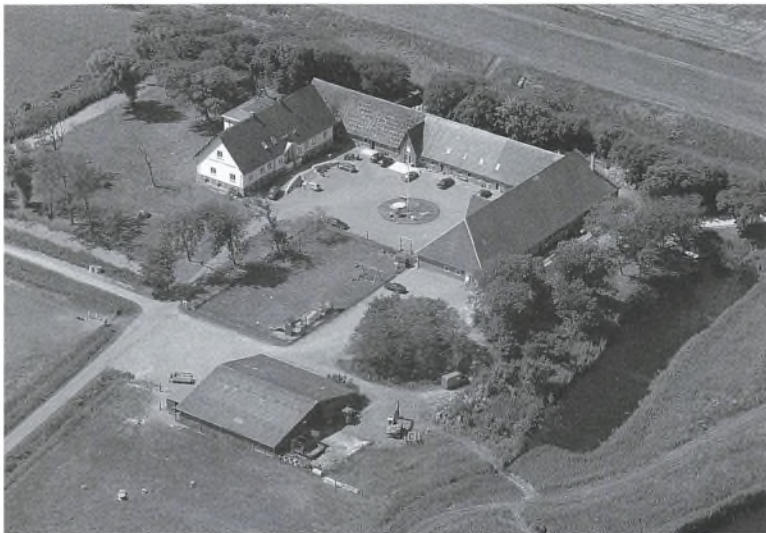
Luftfoto af Hohenwarte.

ningen. Besætningen bestod primært af 12 malkekøer og et par heste. Derudover var der handel med stude og græsning af stude. Kun 2-3 fener blev dyrket med korn. Foruden driftslederen var der fodermester og anden medhjælp. I hovedbygningen var tre piger og en privatchauffør.