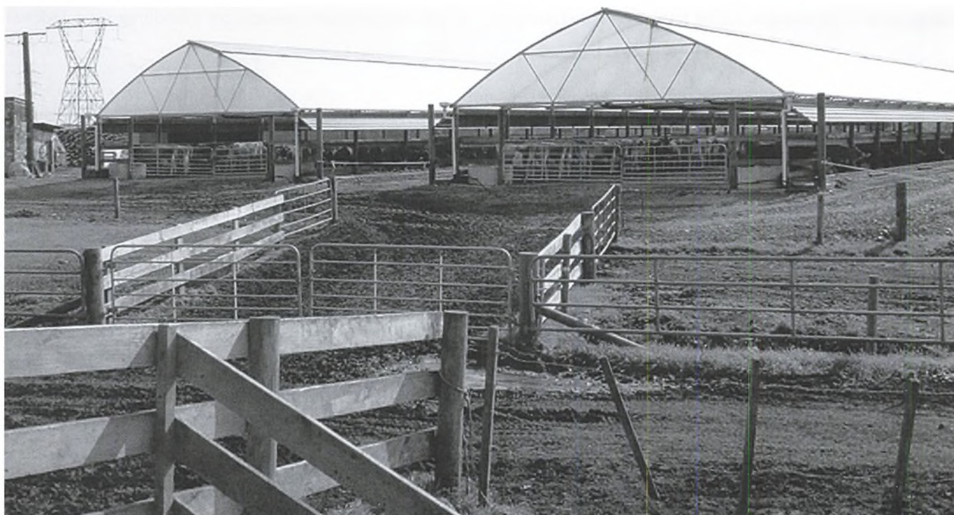
På Sydøen af New Zealand er og bliver der opført flere af de såkaldte "herd homes", hvor køerne kan være, hvis vejret er dårligt, eller græsset skal have fred. Bemærk: Køerne har intet hvileareal udover spalterne.

Det er i dag sådan, at en gennemsnitlig landmand i EU får 19 % af sin indkomst via støtte. Det kan så sammenlignes med USA og New Zealand, hvor det er henholdsvis 8 og 1 %, mens det i Norge og Schweiz er henholdsvis 57 og 55 %. De ligger også rimelig højt, når det gælder konkurrenceforvridende støtte. New Zealand giver den højeste