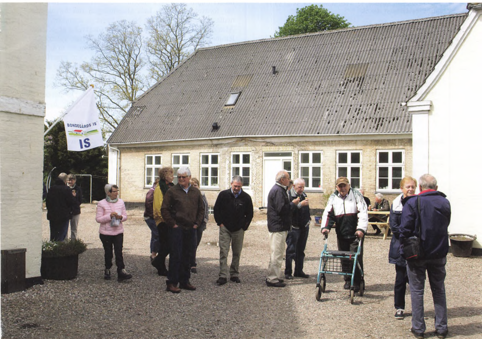
Fra årsmødet's besøg på Frydendal