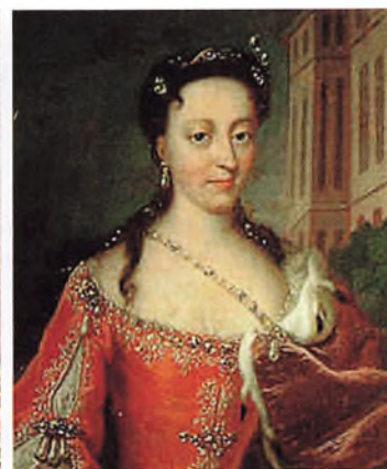
Prinsesse Sophie Hedevig

I 1735 solgte Carl Adolf von Plessen de vendsysselske besiddelser for at koncentrere sig om sine syv sydsjællandske herregårde. Carl Adolf von Plessen var også engageret i oversøisk handel, både i det asiatiske og det Vestindiske-guinesiske Kompagni.