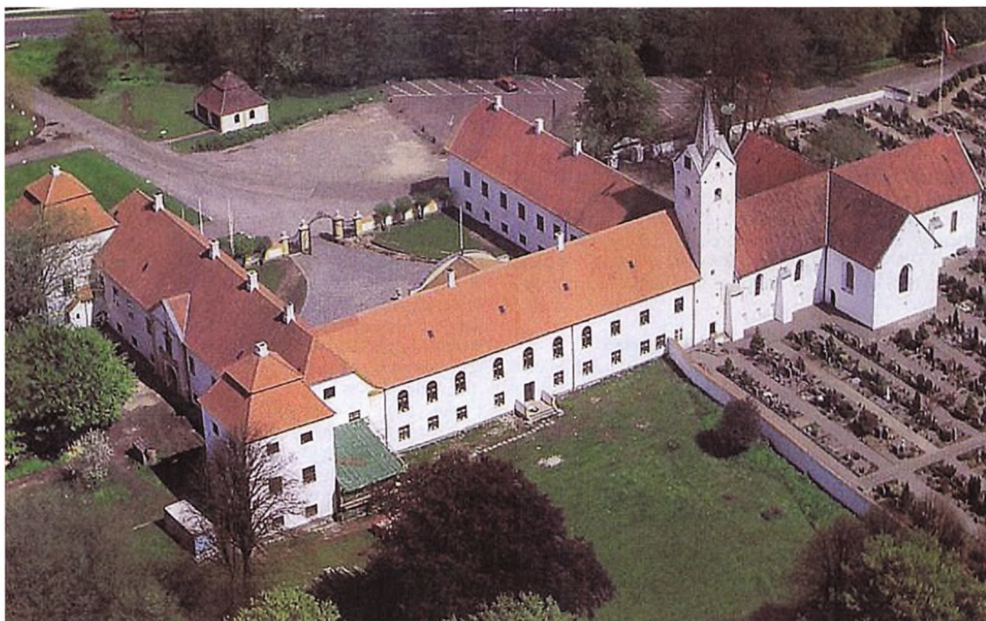
Dronninglund set fra luften

Dronninglund slot, som den gamle hovedbygning kaldes, består af et trefløjet anlæg og kirkefløjen Kirken er fra Benediktinernonneklosteret ligesom øst og sydfløjen. Vestfløjen er opført af Hans Johansen Lindenov efter hans overtagelse af herregården. Omkring 1755 begyndte generalbygmester Lauritz de Thurah for lensgreve Adam Gottlob Moltke, som havde erhvervet hovedgården i 1754, en ombygning, så hele anlægget fik en mere harmonisk karakter.