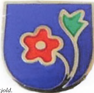
Slægtens Øvles våbenskjold.