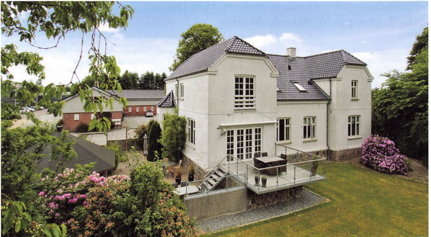
Stuehuset opført 1908 efter brand.