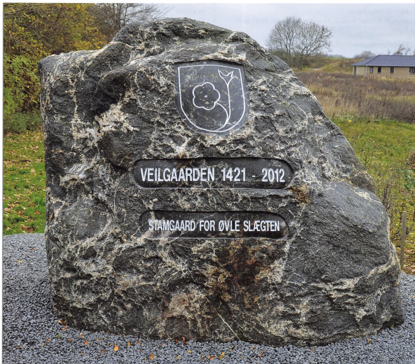
Øvlistenen med Malling.