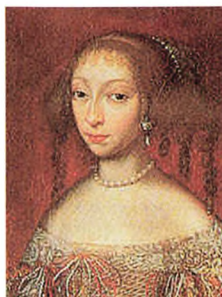
Dronning Charlotte Amalie