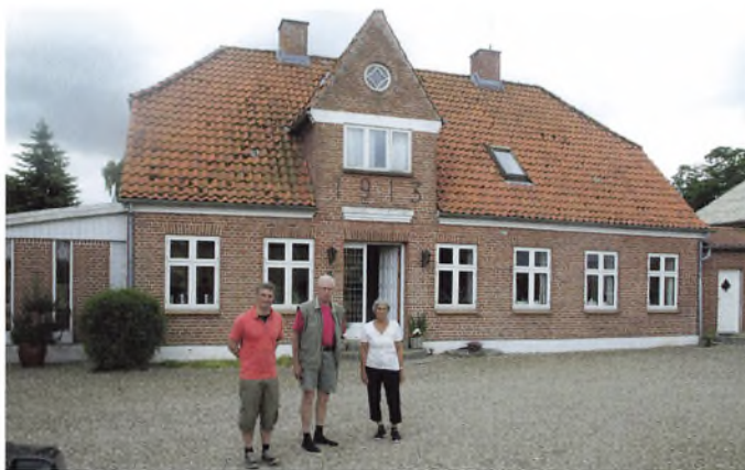
To generation foran stuehuset på Vestergård.