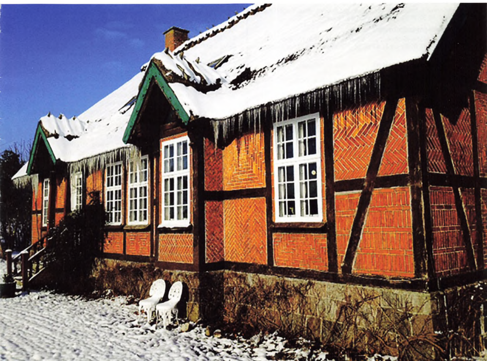
Knudsrødgård ved Slagelse