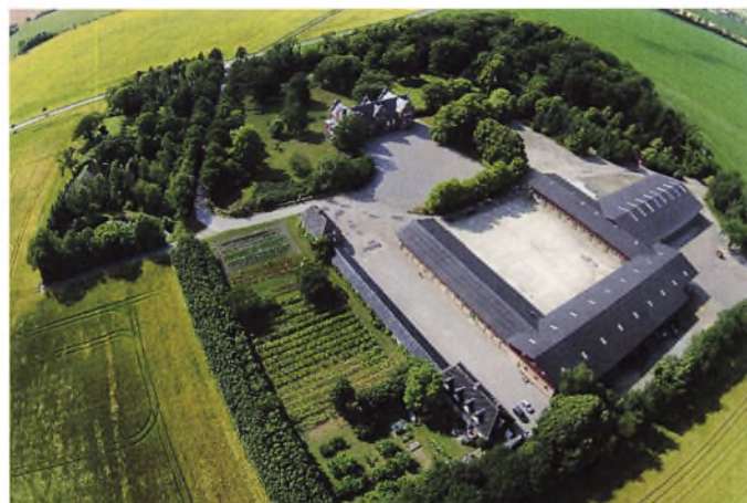
Af dette luftfoto fornemmer man Øllingsøe omgivet af det flade Lolland.