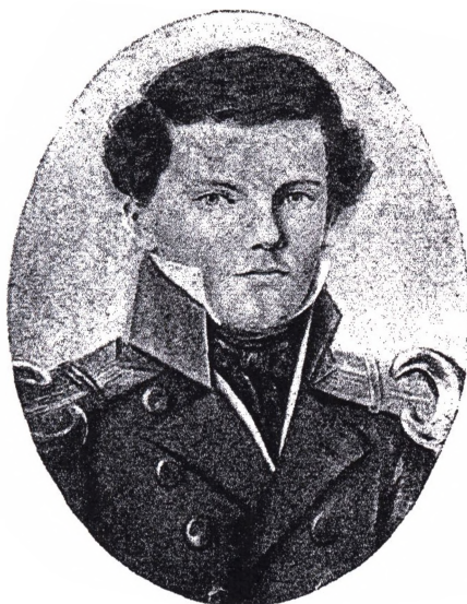
Jens Vilhelm Dahlerup.