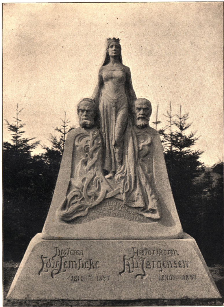
•Modersmaalet• i Skibelund.