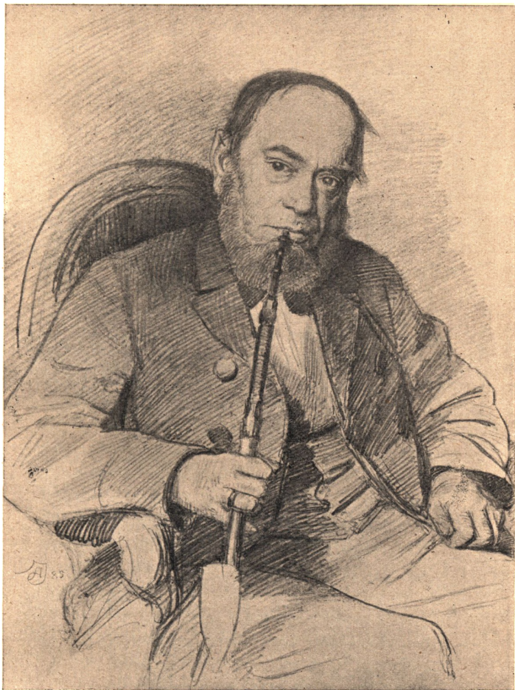
Edvard Lembcke. (Efter en Originaltegning af A. Jerndorff.)