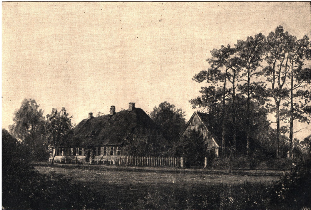
Jørgenslyst. Efter Maleri.