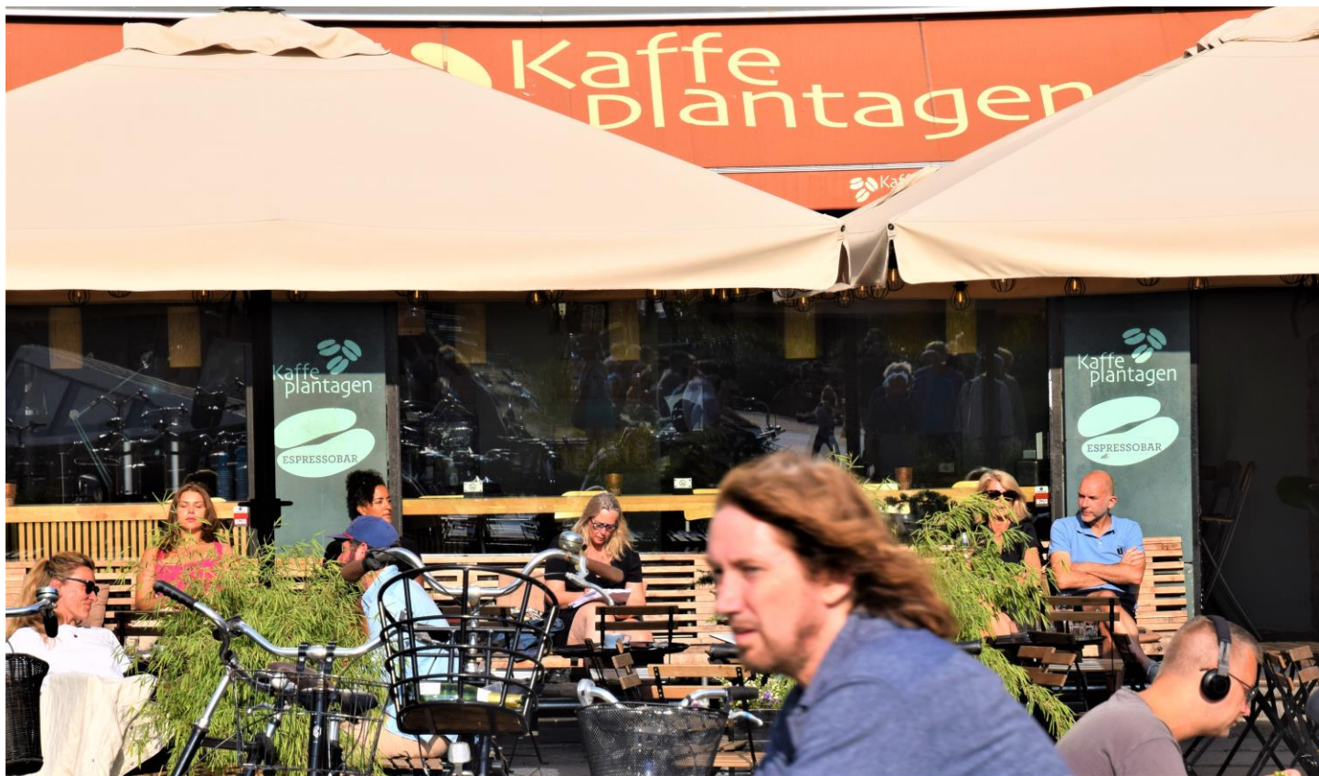
Café Kaffeplantagen, Enghave Plads 1 (juli 2021)