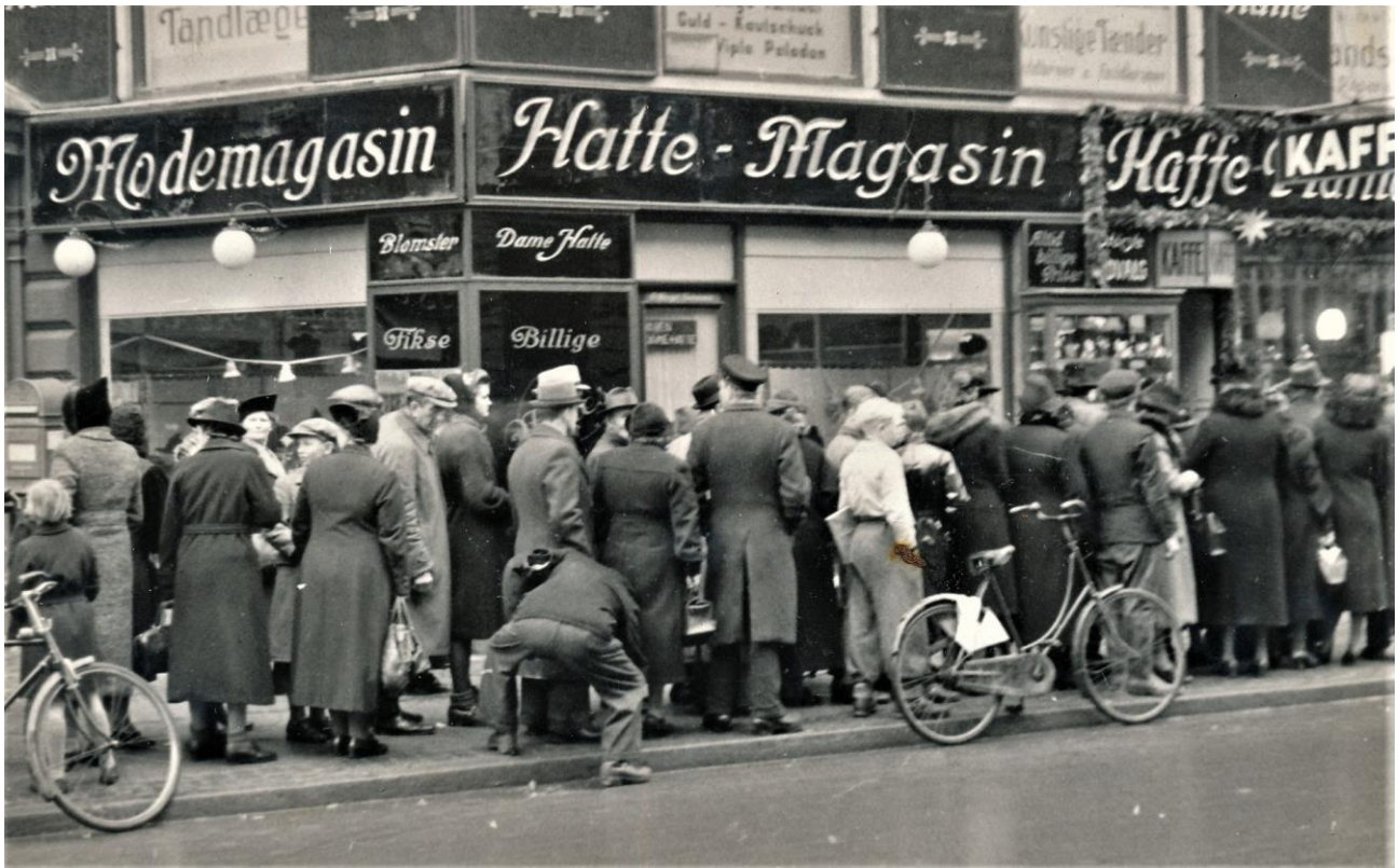
Kø uden for Kaffeplantagen. December 1945?