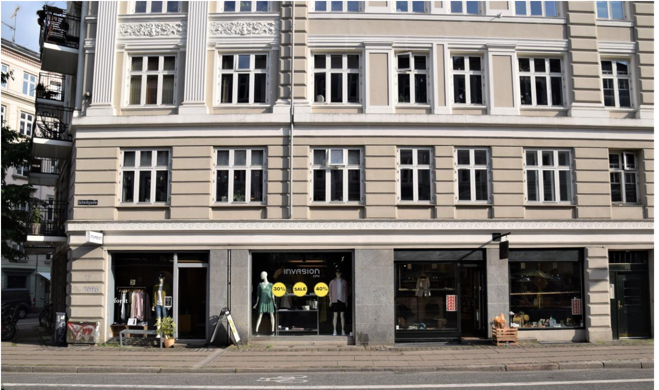
Istedgade 99 (tidligere 97). Kaffeplantagen lå, hvor Invasion nu ligger (juli 2021)