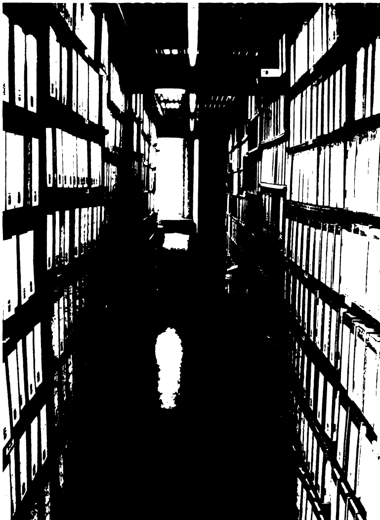
Reolgang i Rigsarkivet på Slotsholmen med Danske Kancellis kopibøger og koncepter og indlæg til kopibøgerne, pakket forsvarligt i moderne arkivæsker og mærket med bind- og pakkebetegnelser og streghoder.

holdet mellem kongen og de forskellige befolkningsgrupper. Det er her iøjnespringende, at den enevældige styreform, der blev indført med Frederik 3.s statsomvæltning i oktober 1660, allerede ses foregribet i kopibøgernes tekster i 1650'erne. Frederik 3. havde tydeligvis et fast greb om administrationen, embedsmænd spurgte usikkert om hans holdning til selv ganske små problemer, og lensmændene indgik kontrakter og aftaler på »kongens