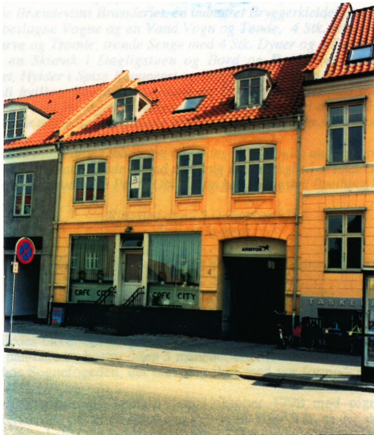
Søren's Værtshus i Nørregade 4 i Ringsted, som det ser ud i dag.