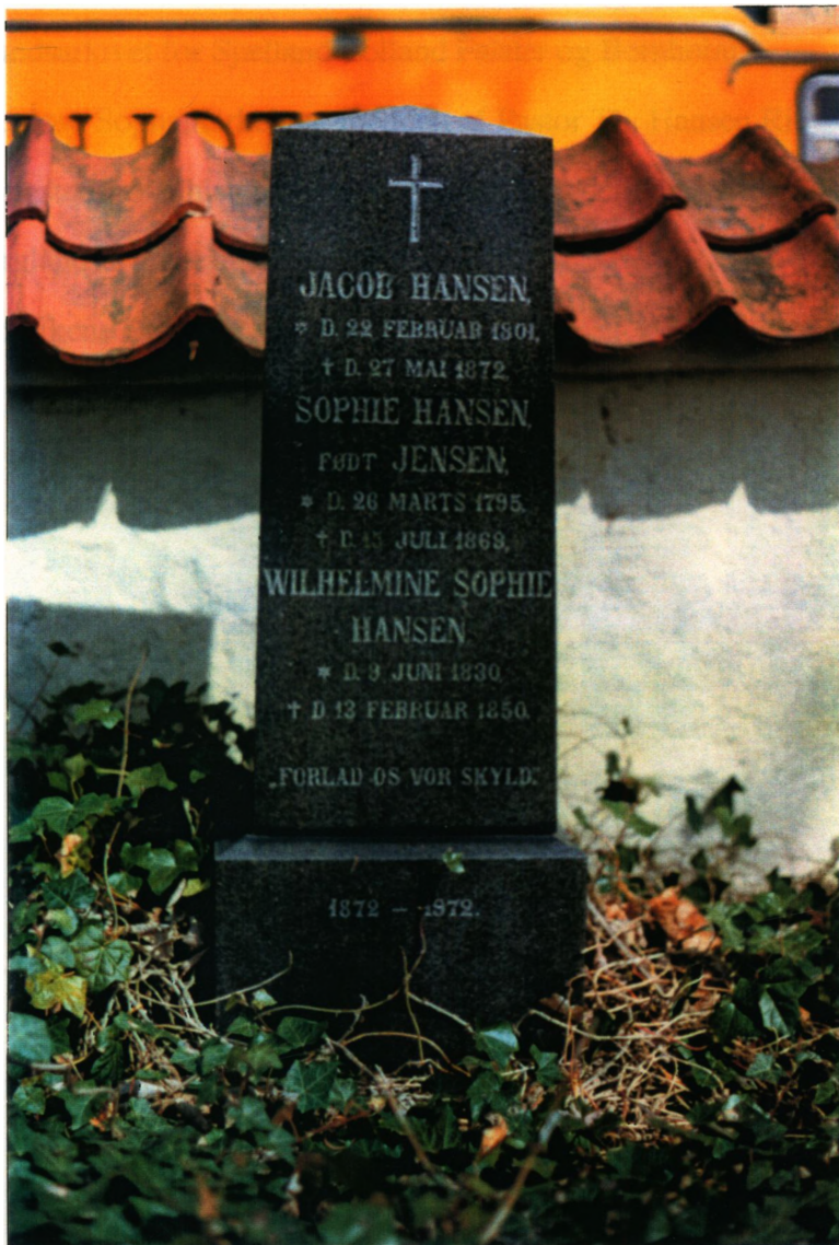
Familiegravstedet på Ringsted Kirkegård