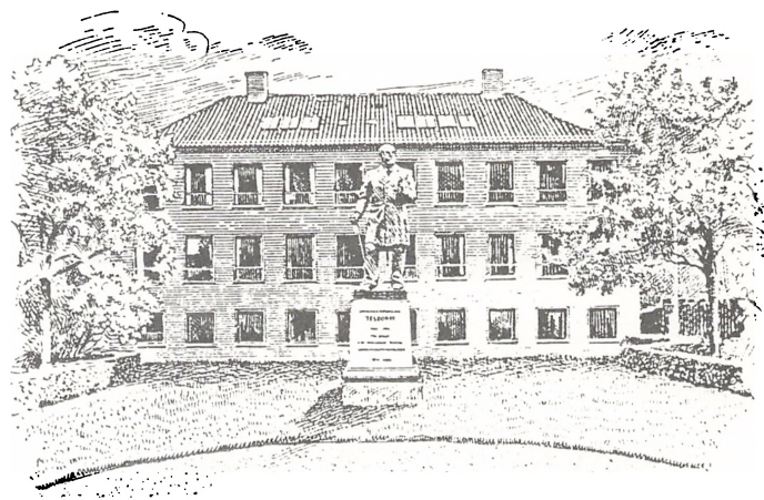
Det kgl. danske Landhusholdningsselskabs hidtidige bygning på Rolighedsvej 26, med statuen af Edward Tesdorpf foran.

En anden af selskabets traditionelle udgivelser er Landbrugsårbogen. Denne vil i 1994-udgaven foreligge i den 95. årgang. Årbogen udsendes til alle selskabets medlemmer og sælges i abonnement og løssalg gennem selskabets sekretariat og boghandlere. Årbogens formål er, at bringe den bedst mulige oversigt over landbrugets institutioner, faglige og fællesøkonomiske organisationer samt oversigt over enkeltpersoner med tilknytning til dansk landbrug. Landbrugsårbogen har gennem årene været meget værdsat af brugerne, idet den ikke er beskrivende eller vurderende, men alene har det sigte, at formidle systematisk ordnede og konkrete oplysninger. Med sit grønne omslag er Landbrugsårbogen et velkendt stykke »inventar« på alle konto-