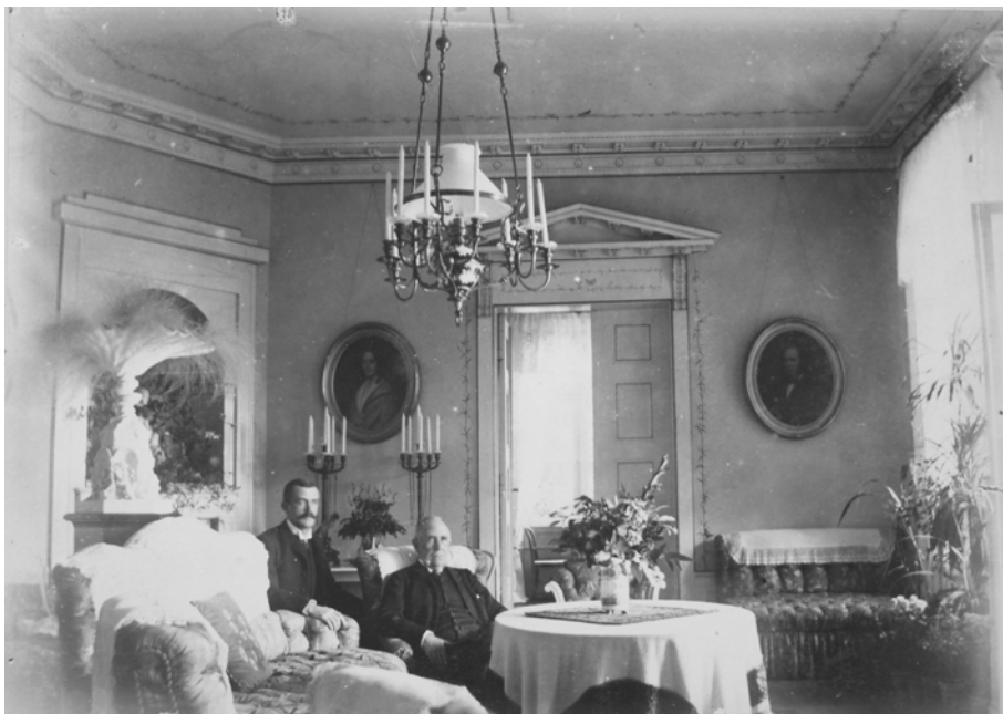
Interiørfoto fra Øregaard i 1880'erne.