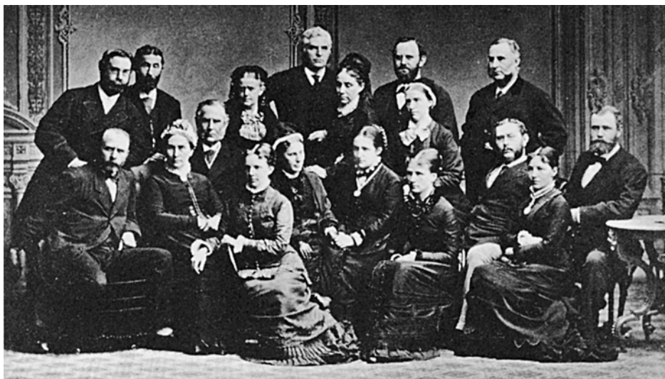
A.N. Hansens børn og svigerbørn, ca. 1873. Efter Blixeniana 1979.