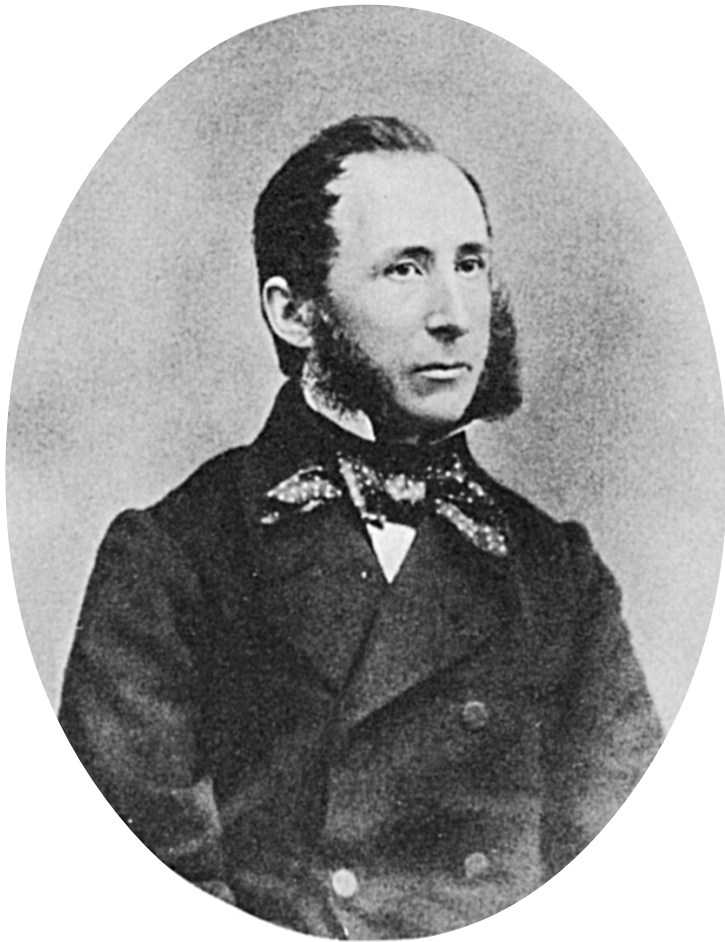
Etatsråd REGNAR WESTENHOLZ 1815-66