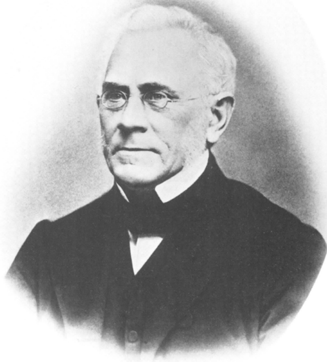
Etatsråd A.N. HANSEN, ca. 1865. Efter Blixeniana 1979.