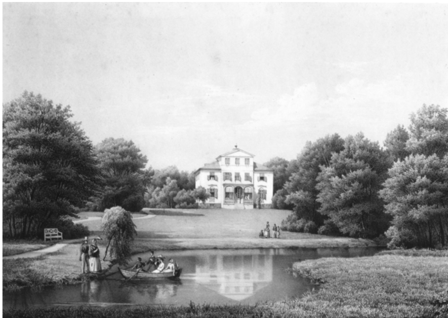
Litografi af Øregaard, ca. 1850.