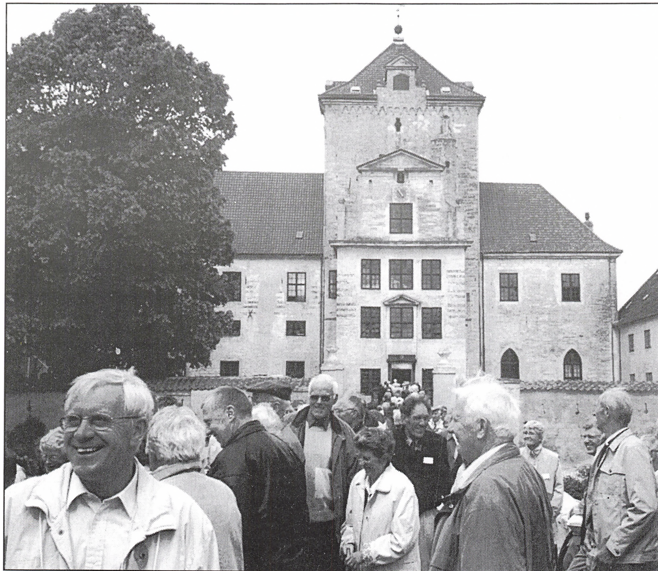
Fra årsmødeudflugtens besøg på Gjorslev gods på Stevns.