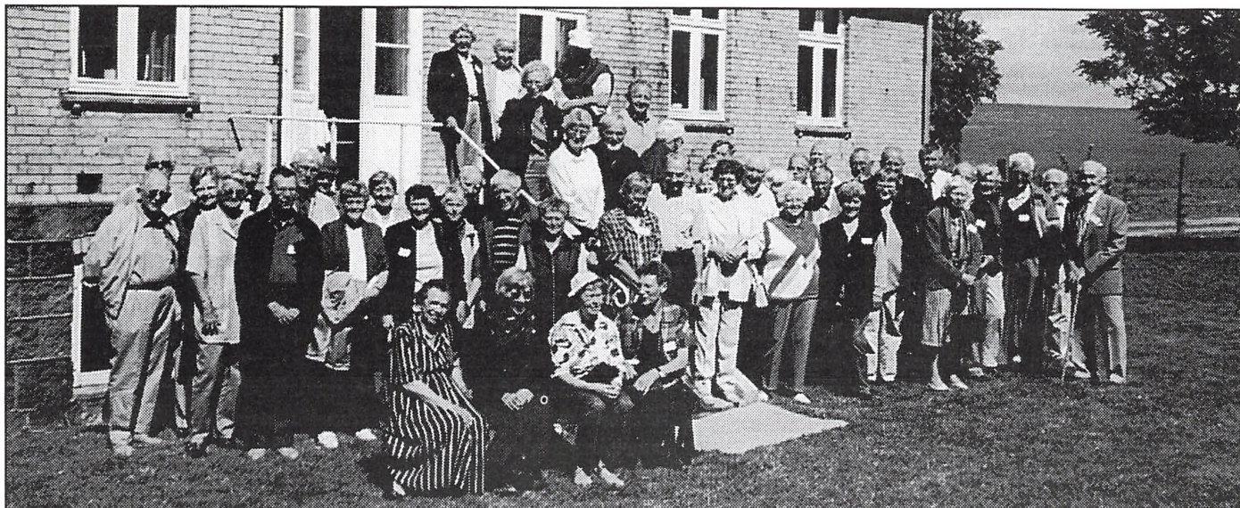
Slægtsgårdsmedlemmer på vej tilbage fra kik på Stevns klint ved Højrup kirke, hvis kor styrkede i havet i 1928.