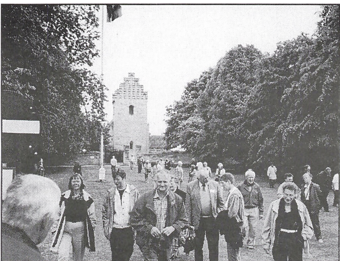
Slægtsgårdsmedlemmer på vej tilbage fra kik på Stevns klint ved Højrup kirke, hvis kor styrtede i havet i 1928.

Men det jeg glæder mig mest over er, at de mange dagbøger blev