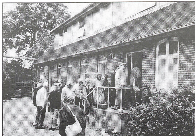
Fra besøget på Damsmosegård i Menstrup.

Det sidst afsluttede regnskab i fonden gav et resultat på ca. 90.000 kr. og viste en formue på ca. 1,6 mill kr.