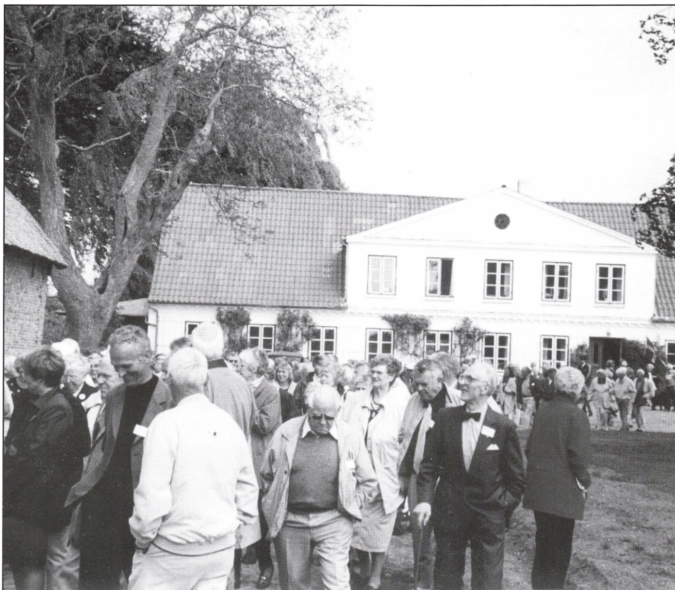
Fra årsmødets besøg på Augustenborg Hovedgård.