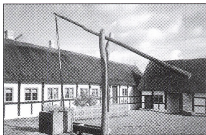
Dammaskegårdens stuehus opført o. år 1800.