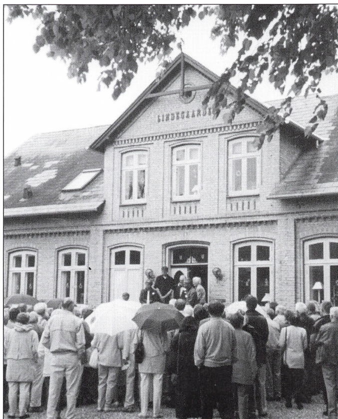
Lindegården, hvor udflugten og årsmødet afsluttedes.

Efter en forventet sejr i krigen havde Hitler visioner om oprettelsen af et tusindårigt germanerige, hvor der kun var plads til arier. Betegnelsen arie betyder ædel, og var blot en af bedsteforældrene af jødisk afstamning, var man ikke arier.