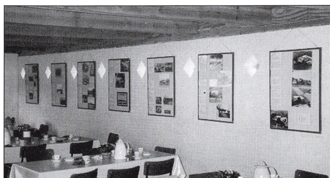
Cafeen på Hessel Landbrugsmuseum, hvor man i denne sommer kan se slægtsgårdsudstillingen.