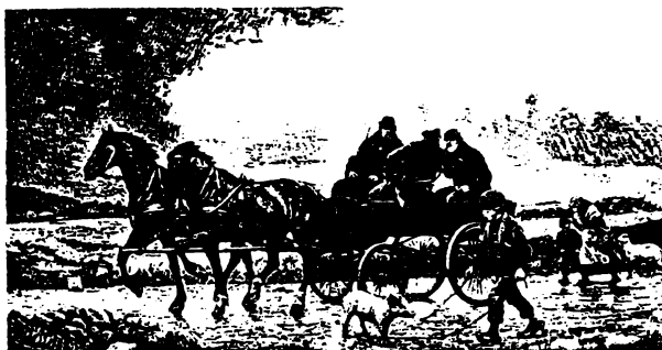
»På vej hjem fra et Marked« hedder dette billede, som kunne ses i »Illustreret Tidende« for 100 år siden.

For nærmere omtale af de enkelte tilbud henvises til Folkeuniversitetets program, omdelt med Hillerød Posten den 11.1. og iøvrigt fremlagt på bibliotekerne.