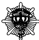
Livgardens regimentsmærke Pro Rege et Grege

En gang garder, altid garder. Dette motto har gennem tiderne været brugt af alle, der efter værnepligten blev hjemsendt fra livgarden. Undertonen, der ligger bag, belyses bedst af gardersangen: