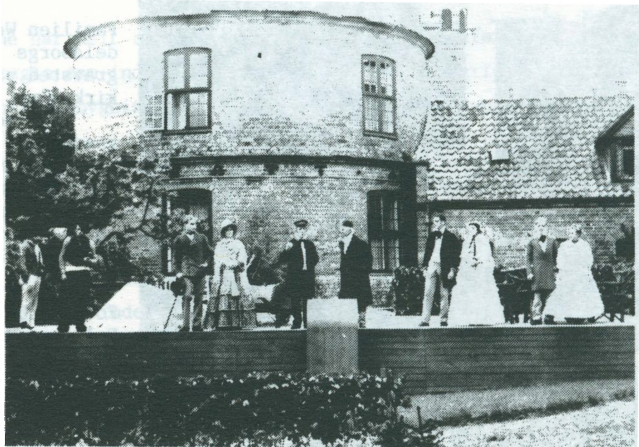
Fotografi fra "Eventyr på Fodrejsen", opført på Frederiksborg Slot i forbindelse med børnehjælpsdagen i 1942.

Et eksempel på et emne, hvor arkivet er ret "tyndt" besat, er TEATERHISTORIE. Det er forbløffende, hvor få billeder der eksisterer fra forestillinger og opførelser, der har fundet sted