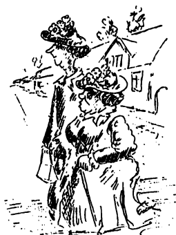
Illustration af T. B. Thomsen

Frederiksborg Amts Historiske Samfund har netop udgivet sin årbog 1991. Ligesom i 1990 bringes under titlen "Vi husker" en række erindringsartikler, i alt 12, hvoraf 3 har særlig interesse for Hillerøds historie.