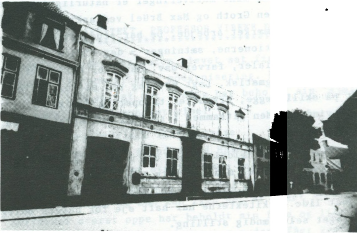
Apoteket omkring år 1900

Den første bevilling til at drive apotek i Hillerød forelå den 7. september 1792. Den blev udstedt til Knud Winding, der drev apoteket til sin død i 1809.