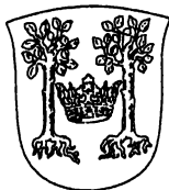
Frederiksborg Amts våben, godkendt og taget i brug 1936.

(Artiklen fortsættes i næste nummer af medlemsbladet).