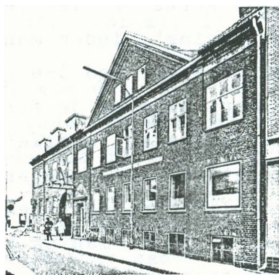
Amtsavisens hus i Helsingørsgade 6-8, 1966.

Som tidligere sagt, var den en beskeden provinsby, hvis egentlige bymæssige del kun udgjordes af Slotsgade. Den lille bys indvånere var imidlertid særdeles velinformede, idet der fandtes ikke mindre end 4 aviser i byen.