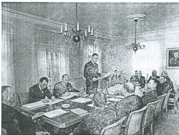
Amtsrådsmøde i mødesalen på "Annaborg" (perioden 1954-58).

Amtsrådets møder fandt sted i byrådssalen på torvet, men da den gamle røde amtstue i Frederiksværksgade blev revet ned, blev den smukke