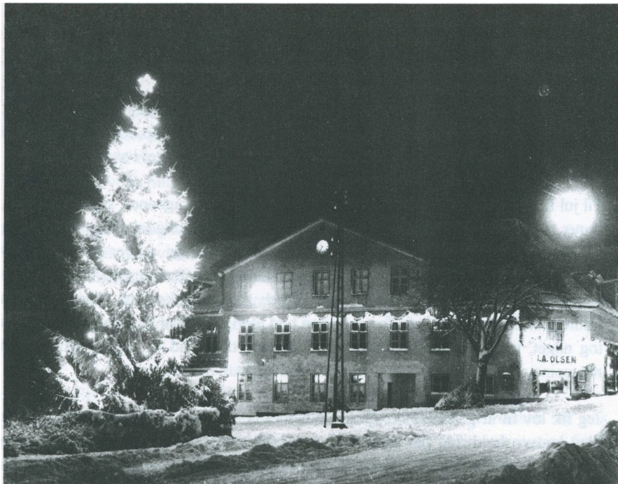
Decemberaften på Torvet sidst i 1940'erne.

Det har altid været en tradition, at om lørdagen, når min mor og far kom fra forretningen, så blev der sluppet af. Vi fik kaffe og ostemadder og brød. Så blev der ryddet af, og glassene kom frem, og så fik vi cognac og likør, den der fra Heering med guldglimmeret i, Curaçao hed den. Den kunne jeg godt lide. Jeg var jo ikke så gammel, da jeg godt kunne lide en lille likør. Men jeg har været konfirmeret, før jeg fik lov til at drikke. Derimod fik jeg lov at ryge meget tidligt, allerede som 10-12-årig, men kun sammen med min far og mor.