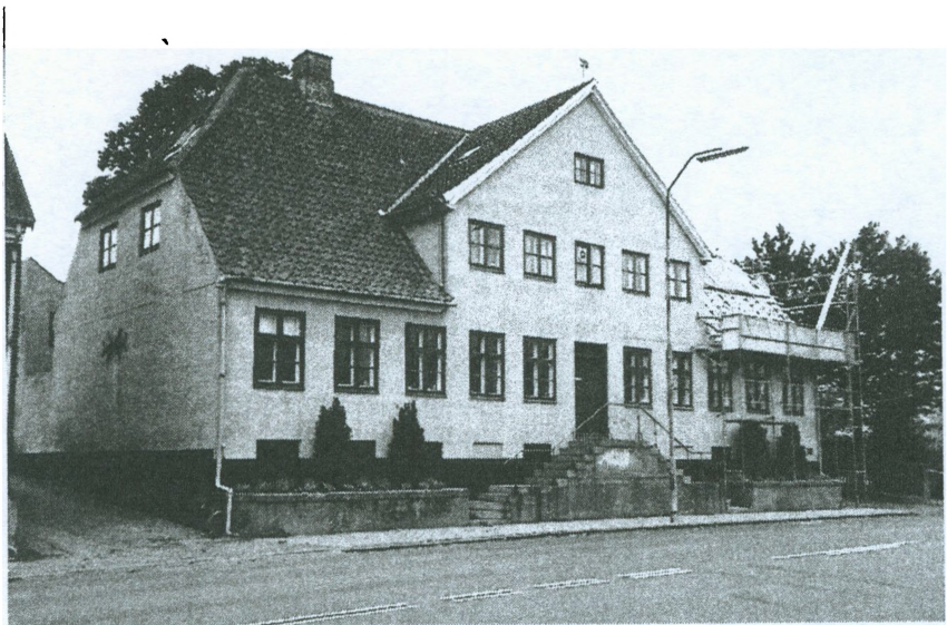
Frederiksværksgade 23. Årets hus 1997.

Ejendommen Frederiksværksgade 23 er beliggende i Nyhuse i det tidligere Slotssogn, der i dag indgår som en del af Hillerød by. Nyhuse var oprindeligt en selvstændig by der lå udenfor Hillerød. Det var en køn og velbygget lille by med mange smukke huse. I slutningen af 1960-erne blev byen sammenlagt med Hillerød, og samtidig gennemgik byen en gennemgribende forandring. Ved den lejlighed fik "Årets hus" nye naboer, nemlig butikstorvet på den anden side af gaden, som unægteligt er opført med et helt andet formsprog end den øvrige bebyggelse i området. Nyhuse ændrede karakter og fik præg af forstadsbebyggelse. Ejendommen Frederiksværksgade 23 er med sin tilstedeværelse mellem moderne naboer med til at fortælle, at området har en lang ældre fortid, end man umiddelbart skulle tro.