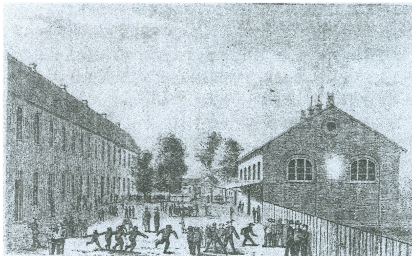
Den lærde Skole, set fra gården, før branden i 1834.

musikken lød i den dunkle skov, ledsaget af god sang fra kraftige smukke stemmer, der gav genlyd fra “det gamle skønne Slot i Sæn....”