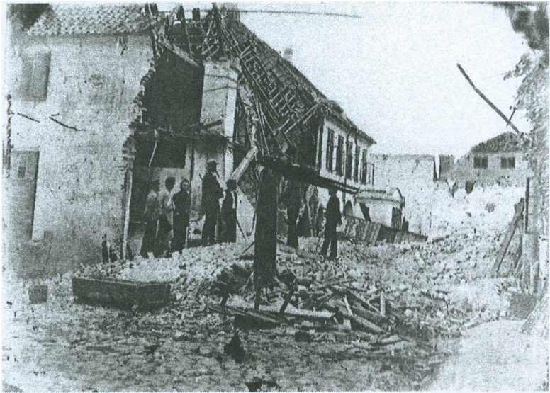
Baggården til Slotsgade 3, den 20. august 1873, fotograferet af C. Rathsch. - Nordsjællandsk Folkemuseum.

par dage efter eksplosionen: “De fem Lig fra Sadelmagerværkstedet fandtes ikke paa Stedet selv, men ført tvers over Gaarden, hvor de laa i en Række op ad en Mur under en Grusdyng.”