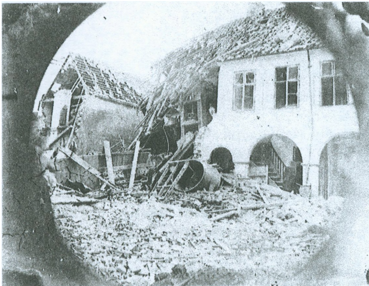
De sammenstyrtede bygninger set forfra.

styrkede totalt sammen, og Deppe og Poul Johan var dræbt på stedet under det sammenstyrtede hus. Gerlach overlevede. Redningsfolkene fandt ham under nogle murbrokker, men han var så hårdt medtaget, at han døde få dage senere.