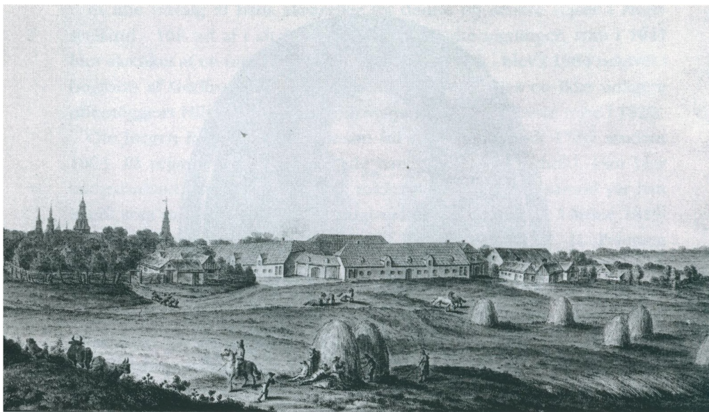
Stutteriet i begyndelsen af 1800-tallet. Frederiksborg Ladegård er bygget 1742-46 af Lauritz de Thurab. Mellem træerne til venstre for ladegården skimtes stutmestergården. Akvarel. Nationalmuseet.

Den ene mindstens indskrift er ikke så gådefuld, hverken hvad angår navnet eller årstallet. »Abildgaard« er utvivlsomt den berømte veterinær, Landbohøjskolens grundlægger, Peter Christian Abildgaard (1740-1801), som var bror til maleren Nicolai Abildgaard. P. C. Abildgaards store indsats for at reorganisere Det Kongelige Frederiksborgske Stutteri tog netop sin begyndelse i 1776. Den kongelige kommission, der med Abildgaard som sekretær var blevet nedsat i marts 1776, havde allerede i april samme år afgivet en betænkning, hvorefter en ny stutteridirektion var tiltrådt, stadig med Abildgaard som en meget virksom og dygtig sekretær. Opgaven var at arbejde på at genvinde Frederiksborgstutteriets tidligere berømmelse - ikke alene ved, at det skulle forsyne den