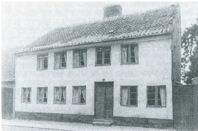
Helstingørsgade nr. 46 (nuværende nr. 9) 1913. Huset er fra 1768, men er senere udvidet, bl.a. med opførelsen af en 1. sal. Bag huset lå bestestald og urmagerværksted. Huset blev nedrevet i 1914.