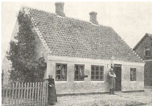
HJEMMET I RANUM