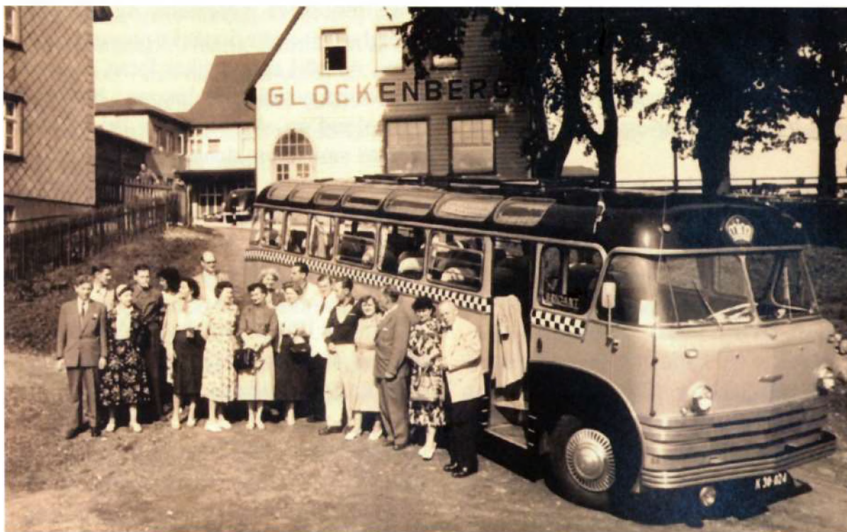
Bus foran Hotel Andreasberg