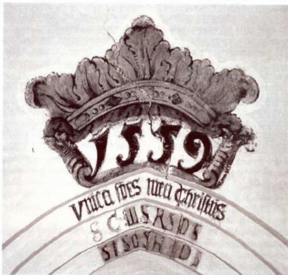
Kongekrone med Christian III's valgsprog og årstallet 1559 — året hvor Skt. Olai Kirke blev færdig i sin nuværende skikkelse

et blad fra Frederiksborg Amts Historiske Samfund