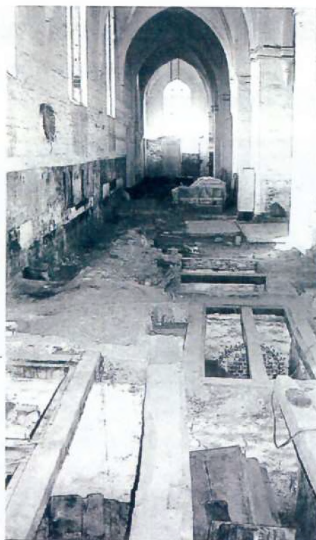
Fotografi fra restaureringen af Skt. Olai Kirke. Forrest ses nogle kistebegravelser

Undersøgelsen af kistebegravelserne i Skt. Olai Kirke er helt unik i Danmark og den har medført at man har fået megen ny viden om Helsingørs borgerskab i 1700-tallet.