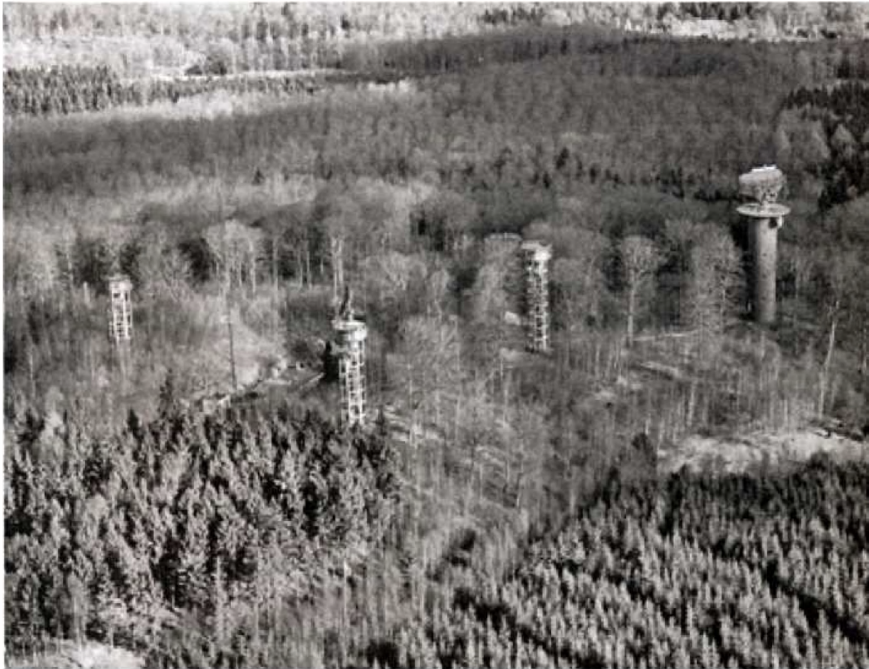
Luftfoto af Radarstation Muldebjerg.

rum i de nævnte bunkere. 12 måneder efter byggeriets begyndelse blev radarstationen afprøvet for første gang, og i midten af maj 1955 blev den erklæret operativ.