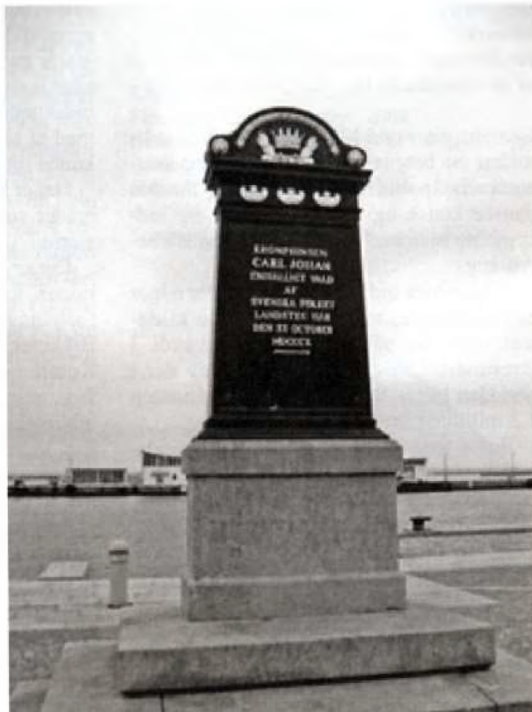
Monument på havnen i Helsingborg rejst til minde om Bernadottes ankomst til Helsingborg 20/10 1810

Han var fransk af fødsel, sprog, og patriotisk sindelag, født i Pau ved grænsen til Spanien i 1763. Faderen var jurist men uden økonomisk eller adelig baggrund, hvilket på den tid var nødvendigt for en karriere indenfor administration eller militærvæsen. Som 17 årig kom Jean Baptiste Bernadotte ind i militæret. Nogle år efter, ved den franske revolution 1789 forsvandt de adelige og økonomiske forudsætninger for en karriere. Yderligere et stort fremskridt for ham var, da Napoleon blev første konsul og senere (1804) kejser af Frankrig. På dette tidspunkt samarbejdede Napoleon og Berna-