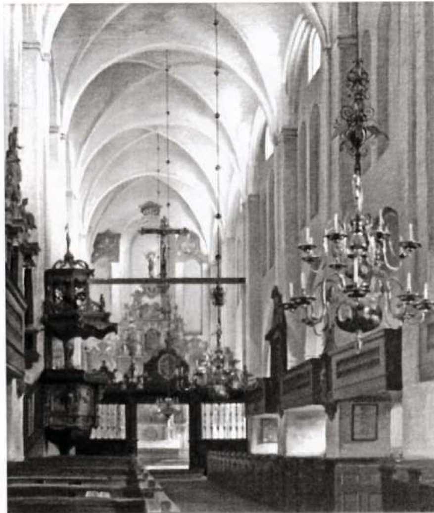
På billedet ser man pulpitu- rerne. Det sidste forsvandt i år 1900

Jørgensen i Holbæk. Dermed fik kirken Danmarks største altertavle, og Esumtavlen kom til Holme-Olstrup for i 1897 at ende på nationalmuseet.