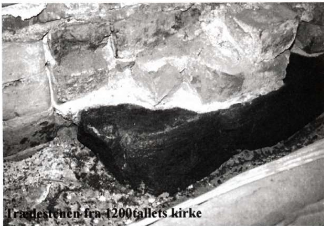
Trædestenen fra 1200tallets kirke

Man begyndte med at bygge et stort nyt kor i stedet for det gamle, den egentlige kirke kunne stadig bruges. Det omfattede de nuværende tre østfag af kirken i samme højde som nu og med tagrytter. Koret lukkedes med en midlertidig vestmur, så det kunne anvendes, mens ombygningen skred frem. Unægtelig må kirken have set mærkelig ud med det kæmpestore kor, det dværgagtige skib, som stadig benyttedes og det stumpede tårn. I samme byggeperiode blev sakristbygningen opført, og i pinseugen 1521 kunne Roskilde-bispen Lave Urne indvie det nye kor, der blev stillet under himmelsk beskyttelse, ikke blot af kirkens gamle vær-