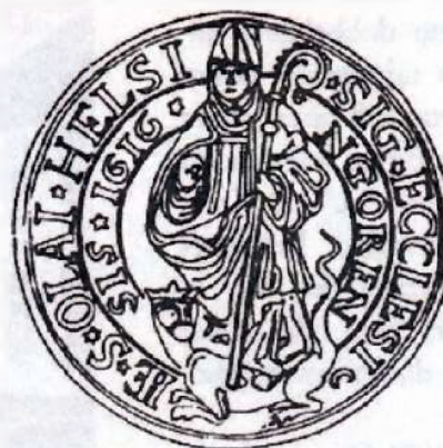
Skt. Olai Kirkes segl

I dag giver de gamle klosterbygninger som nævnt husly til bispekontor og stiftsøvrighed. Der udover er der i underetagen kordegnekantor og konfirmandstue samt et af landets fornemmeste kirkerum Sct. Mariæ Kirke, kun et stenkast fra domkirken Skt. Olai Kirke.