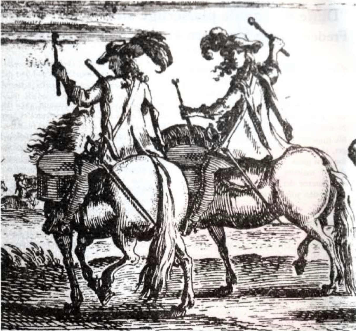
Svenske ryttere med pauker. Udsnit af planche 59 fra Pufendorfværket, 1696

sere og fiske. Slottets idylliske omgivelser var vel også det, der trak dronningen, da hun en lille måned senere og igen i begyndelse af juli rejste dertil.