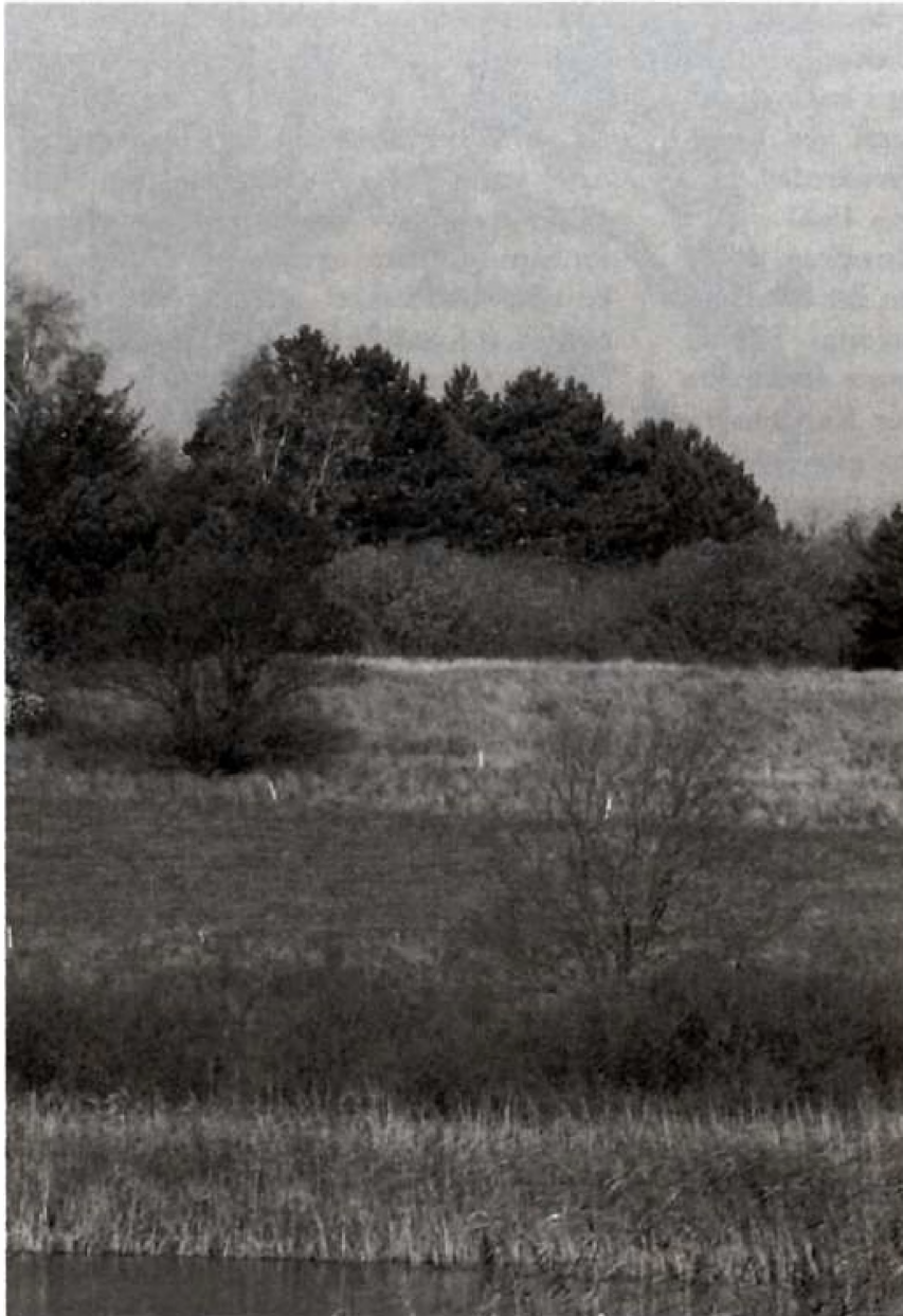
Landskabet ved Kirkesø i Knardrup med Galdebakke i baggrunden, fotograferet mod nord.

ter anses for sandsynligt, at der aldrig har været en galge på bakken i Knardrup. Navnet Galgebakken er fra den nære nutid og resultatet af en sproglig forvanskning. Pænerne sagt og måske mere korrekt - resultatet af en sproglig udvikling. Måske hjulpet godt på vej af en landmåler.