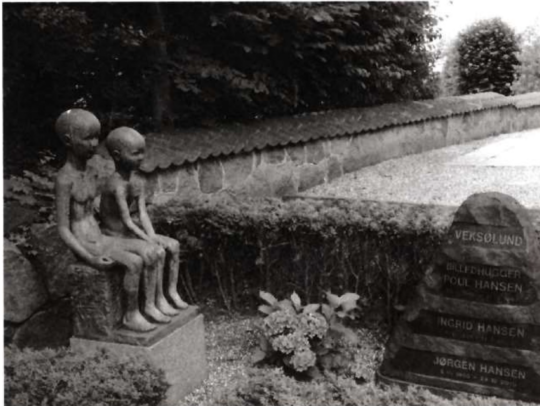
Statuen "Børn" på gravstedet på Vekso Kirkegård