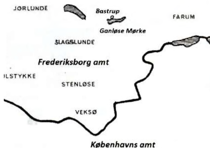
Fig. 4 Den nye amtsgrænse mellem Frederiksborg og København i lokalområdet, som etableredes år 1800. Den fulgte mod syd Værebros Å inde fra området vest for Farum og flyttede et stort område til Frederiksborg. Skitse ved forfatteren.

nien/Projsen i 1795. Udine til freden mellem Frankrig og Østrig i 1797. Rastad til freden mellem Frankrig og Det tyske Rige 1797 - 99. At navnene forekom hyppigt i en dengang førende dansk avis, kan næppe forklare, at de skulle gøres mindeværdige ved at blive tildelt gårde i dette udkantsområde. Og dog!