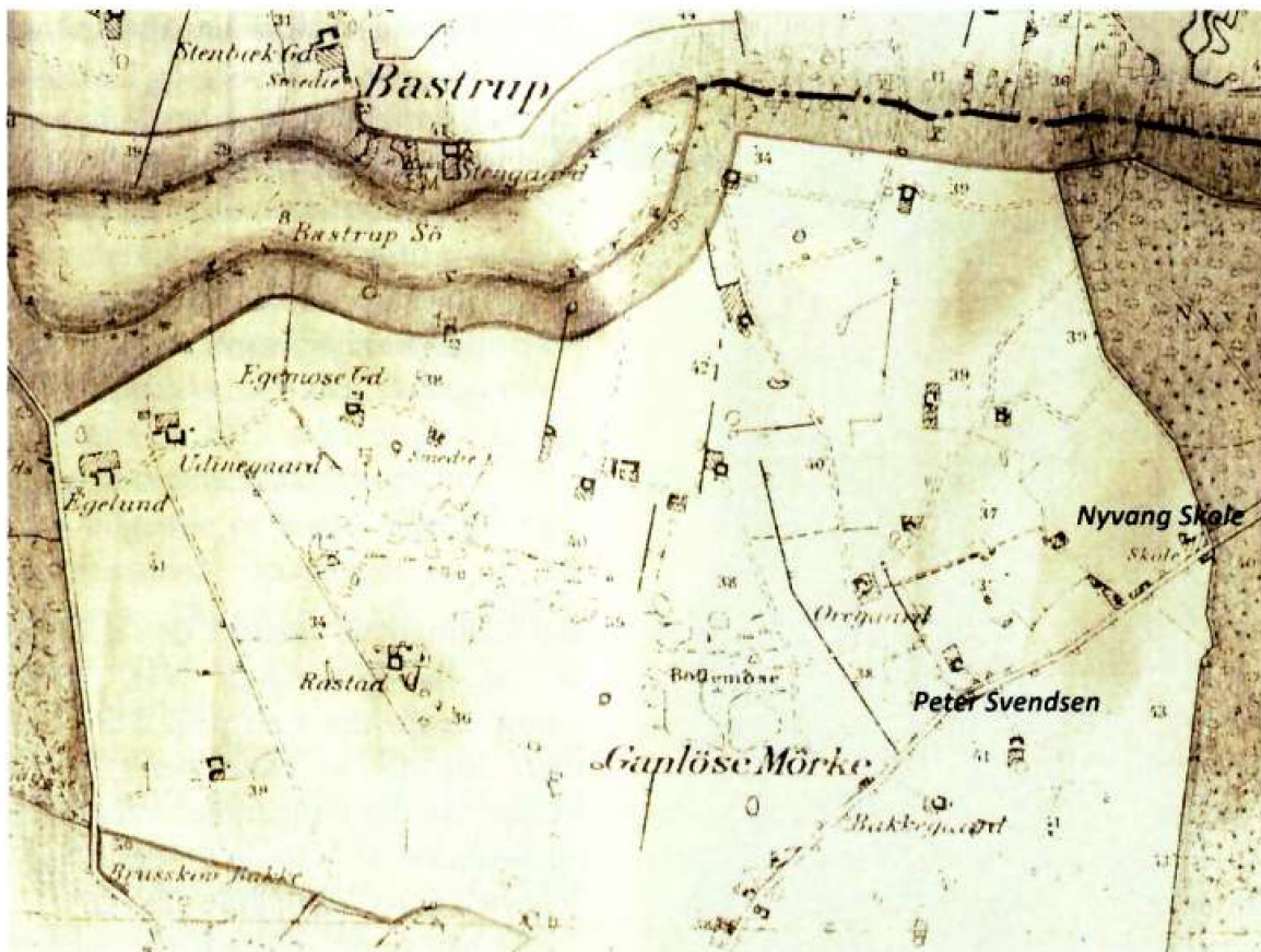
Fig. 3 Kort over Ganløse Mørke.

og byggede en ny firelænget gård lidt længere mod syd, væk fra søen. Han grundlagde dermed gården, der seks år senere skulle få det mærkelige navn Rastad. De tre udflyttergårde havde i de første mange år et vist driftsfællesskab om enggræsning og tørveskær. Det blev ophævet i 1799, da hver og en fik eget skøde på sin gård som arvefæste og selveje. I den anledning blev gårdene tildelt navne, som har undret eftertiden og da sikkert også de dengang berørte bønder. Det er svært at tro, at de selv har været medbestemmende eller blot er blevet spurgt. Navnene fremgår af en protokol fra Frederiksborg Amtsstue af 1799 (3).