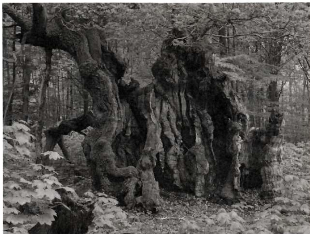
Kongeegen i Nordskoven fotograferet april-maj 2007

Ved enevældens ophør overgik de kongelige slotte til statslig ejendom. Efter sit gitemål til venstre hånd med Louise Rasmussen i 1850, købte Frederik den Syvende i 1854 Jægerspris Slot for at bruge det til bolig for sig og sin hustru, nu lensgrevinde Louise Danner af Samsø. De tog fast ophold på Jægerspris i god afstand fra borgerskabet i København, der var fjendtligt indstillet over for grevinde Danner, som de så som en "opkomling".