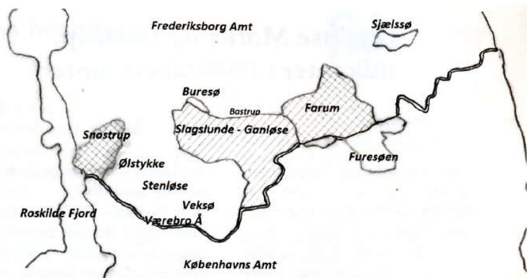
Fig. 1 Amtsgrænsen mellem Frederiksborgs og Københavns amter blev i slutningen af 1700-tallet ændret i flere omgange til det forløb, som vi har kendt indtil fornylig. Denne skitse skal forsøge at illustrere disse forandringer. I 1793 flyttedes det enkeltkraverede område med Slagslunde - Ganløse fra København til Frederiksborg. I 1800 kom de krydsskraverede områder med Farum og Snostrup ligeledes under Frederiksborg. Dette amts sydgrænse kom herved til at følge Værebros Å over en lang strækning. Denne grænse er markeret med en dobbeltstreg. Skitse ved forfatteren.

gelse, idet Snostrup sogn yderst ude, nord for åen hørte under København og ved en tidligere administrativ deling var det oprindelige Jørlunde Herred under Københavns Amt blevet delt. Dette havde medført, at sognene Snostrup og Ølstykke fra det oprindelige herred var forblevet under Københavns Amt, medens Jørlunde var blevet tillagt Frederiksborg Amt. Denne grænse mod Jørlunde er ikke vist på fig. 1. Ved Bastrup og Ganløse - på begge sider af denne grænse ved søerne - havde bønderne overdrev til græsning og gardsel. Mest markant dog på sydsiden, hvor der var store skovområder, som hørte under Kronen. Skove, hvis rester vi i dag kender som Slags-