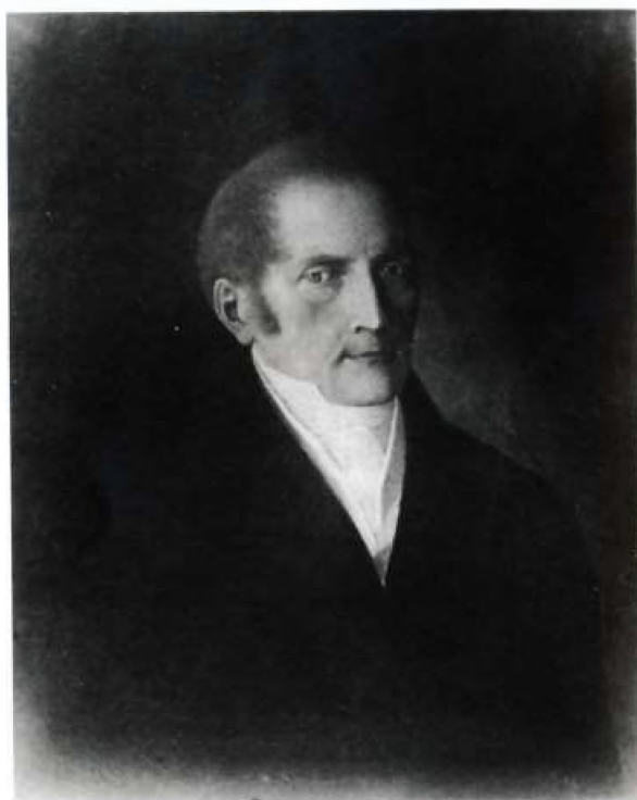
Antoine Bournonville.

En kirkegård betragtes i reglen som et vemodigt sted, hvor gravstenenes kolonner taler deres dystre sprog om de døde, der er begravet her. Asminderød kirkegård er som mange andre – og dog. For den, der begiver sig ind på kirkegården, åbenbarer der sig en smuk og velplejet have, hvor mange gamle, knudrede asketræer kaster skygger over gravminderne, som smykkes af årstidens blomsterhilsner fra de efterladte.