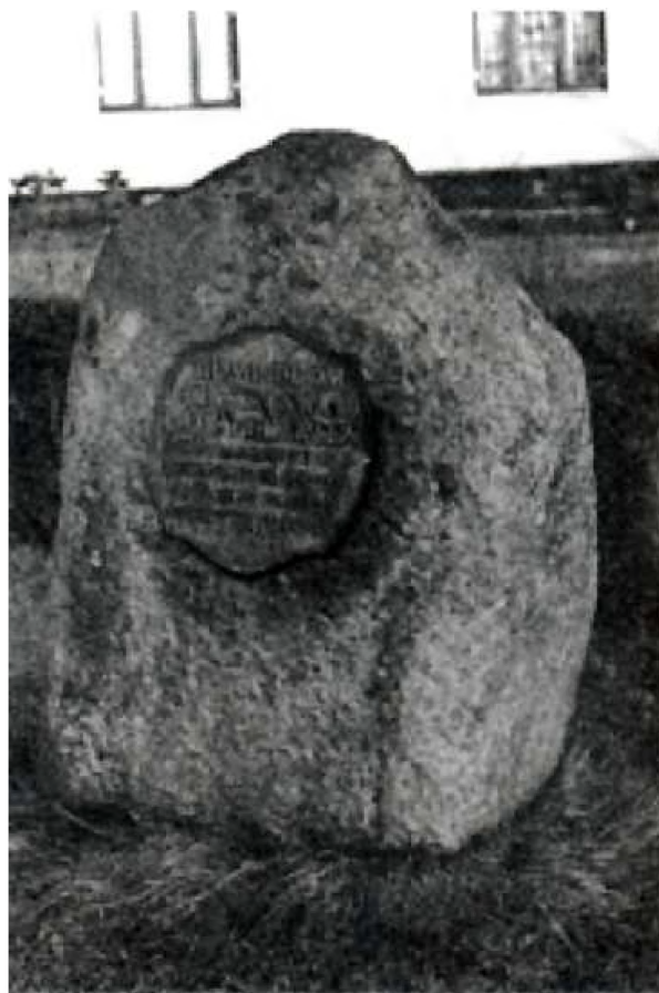
Mindepladen i dag - på stenen på hjørnet af Gl. Præstevej og Frederiksværkvej i Ramløse.