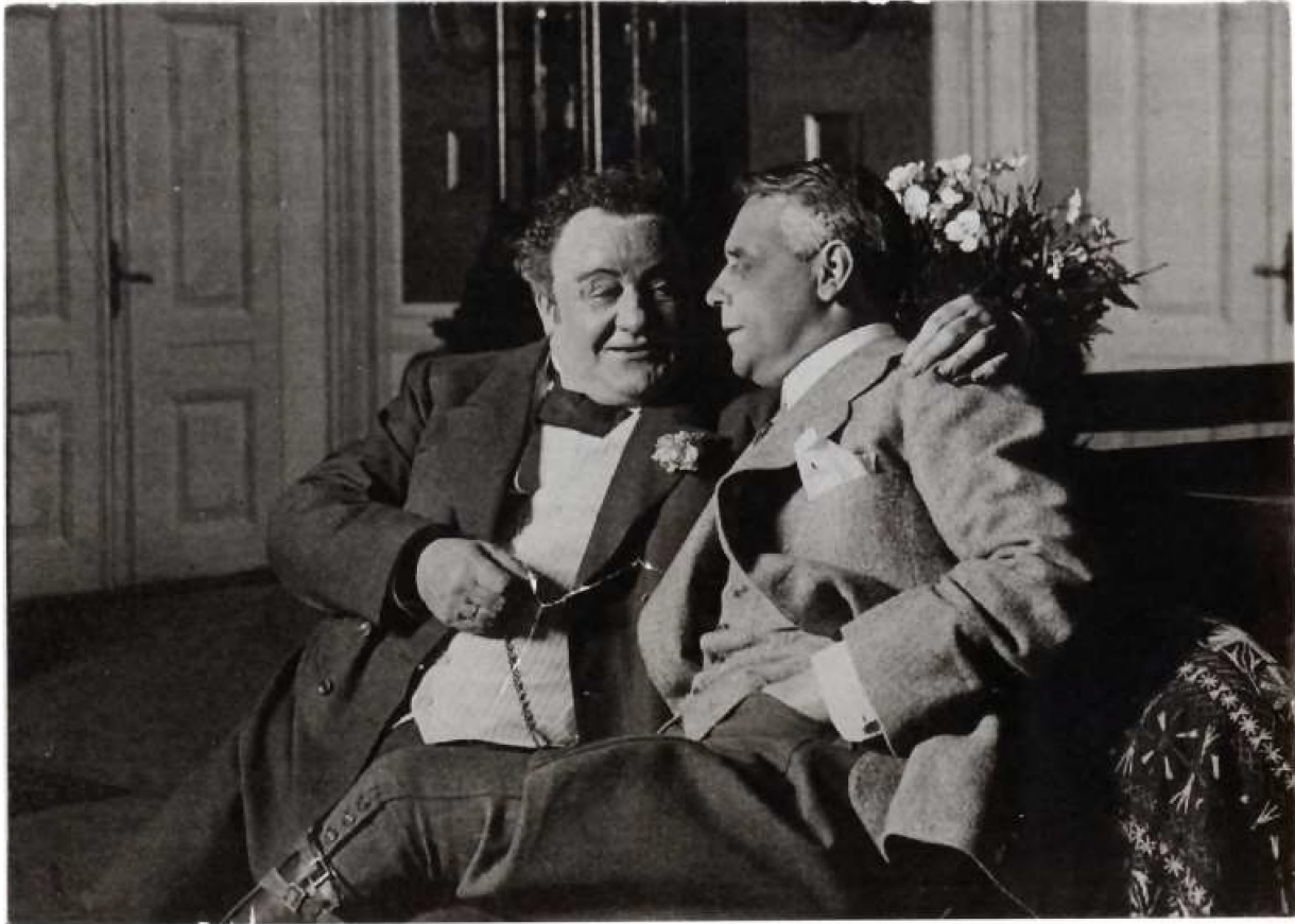
Olaf Poulsen og formentlig Poul Reumert