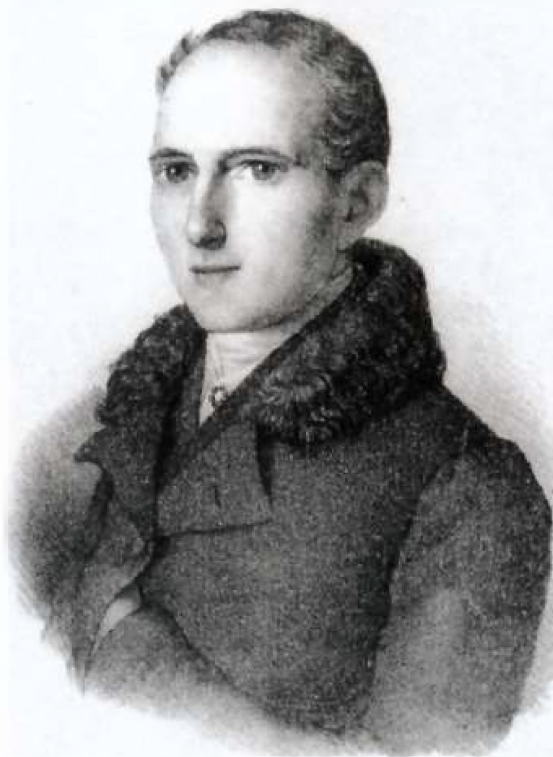
Fr. PALUDAN MÜLLER.

Fr. Paludan Müller. Kopi i Fredensborg Arkiverne af foto på Det Kongelige Bibliotek