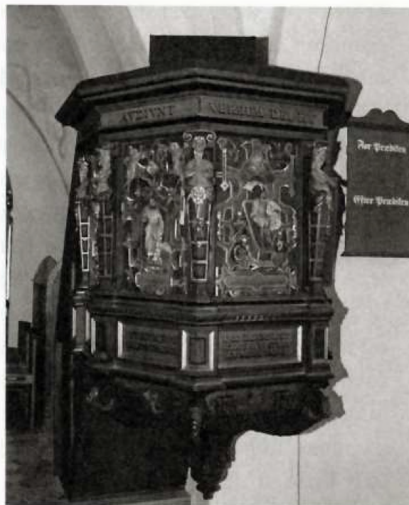
Karlebo Kirkes prædikestol fra 1584. Billedet var bragt i farver i særnummeret fra 2012 af Karlebo Lokalhistoriske Forenings Rytterskolen.