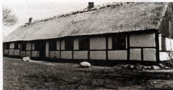
Karlebo gamle Kro. Krovirksomheden går tilbage til 1500-tallet.

denne anmode bønderne om ikke at tale med "løse" ord til ham på den måde. Det havde præsten afvist med den bemærkning, at Anders ikke havde noget med bønderne at gøre. Samtidigt havde præsten slået ham i brystet, så han var faldet til jorden, og da han havde rejst sig igen, havde præsten slået et stort hul i hans pande med et ølkrus. Anders var derefter løbet ud, men han havde derefter prøvet at hale præsten ud af rummet ved at slå et vindue i stykker med sin kære. Herefter var han gået hjem til sit kvarter sammen med kroværten. Også præsten havde villet ud til Anders, men han var blevet forhindret i dette af kapellanen og andre tilstedeværende.