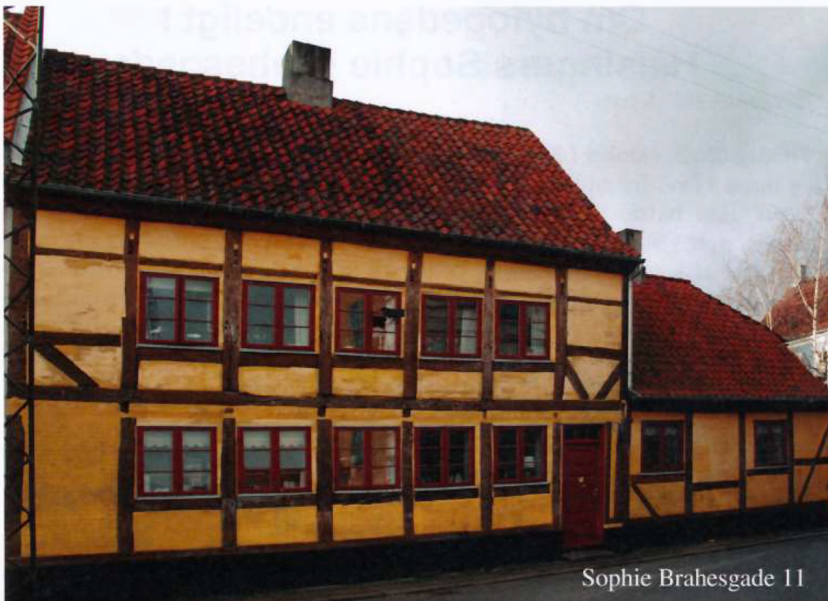
Sophie Brahesgade 11