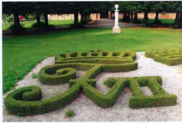
Frederik VII og grevinde Danners smukke initialer i Jægerspris have