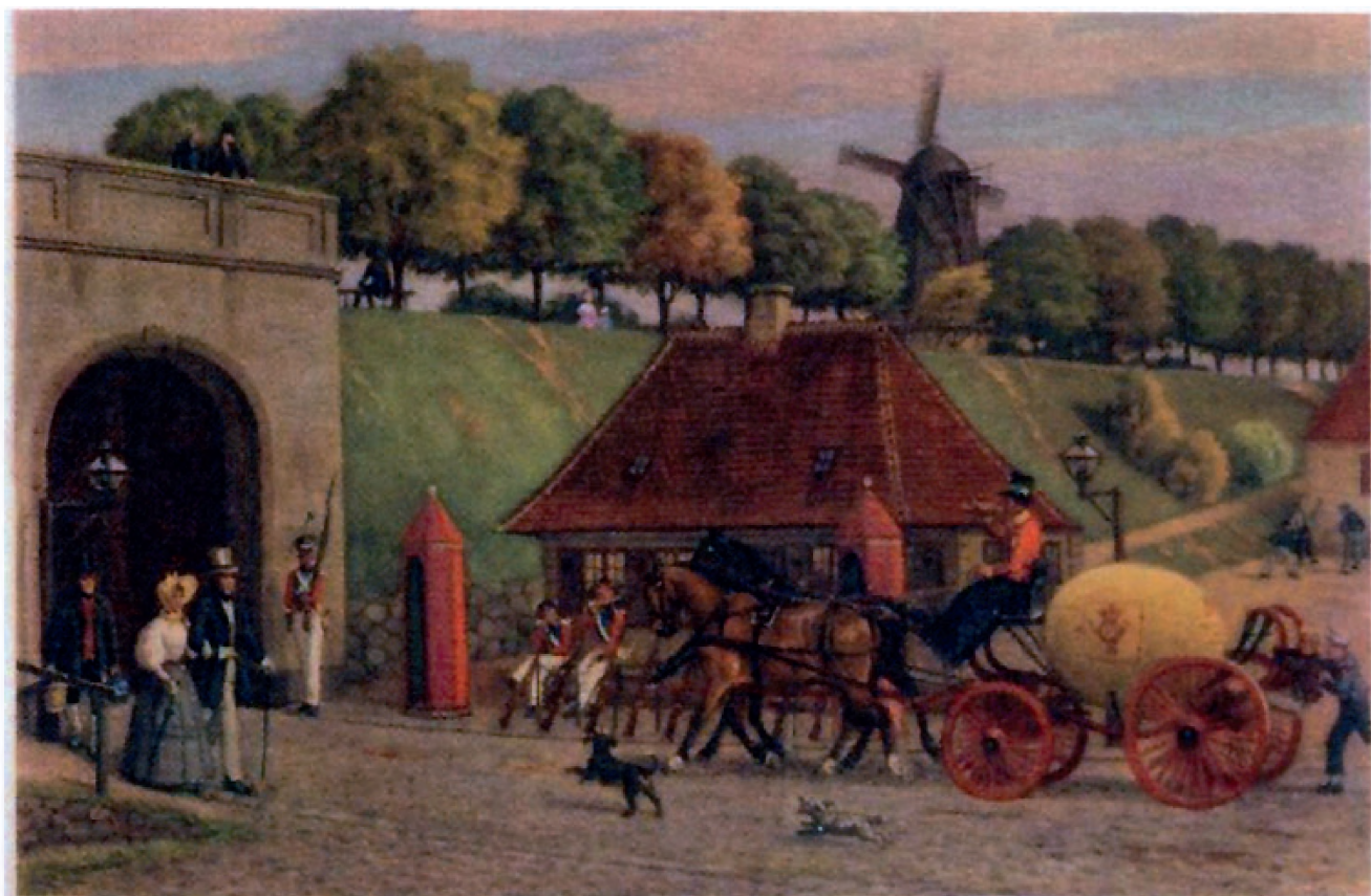
Kugleposten passerer Vesterport ca 1845. Kugleposten kørte mellem København og Altona 1815-1865.