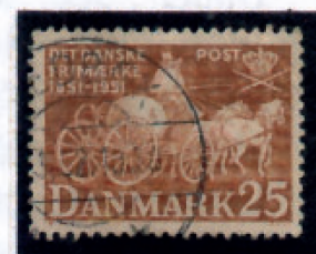
Frimærke udsendt i 1951 100 året for udsendelse af det første danske frimærke.

I 1533 vides det, at der var daglig brevpostforbindelse mellem Helsingør og København, og allerede i 1565 gives der befaling til Jørgen Sehested at holde 2 postklippere ved Krogen (slottet Kronborg), der altid kunne stå rede til straks at føre de fra Skåne kommende breve og bud til kongen (en klipper er en hurtigt sejlende kofardiskib).