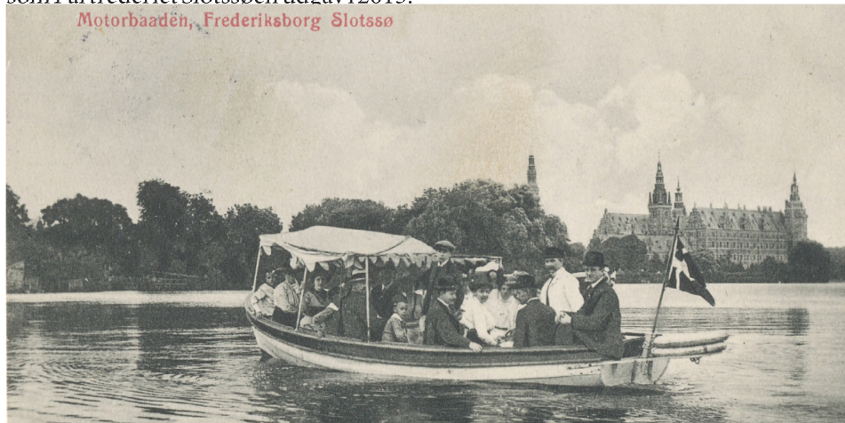
Motorbaaden, Frederiksborg Slotssø

borg var hjemmehørende i Hillerød. Det ”lugter” igen lidt af en havneby