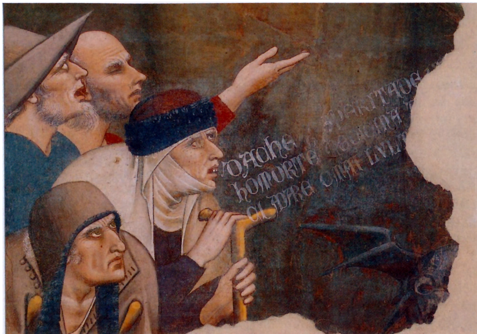
Udsnit af ældre billede med spedalske som motiv fra 1300-tallet. Fresken kaldes "Dødens triumf". Det er malet af Andrea Orcagna og befinder sig i museet Santa Croce i Firenze.