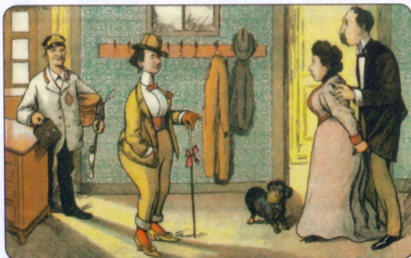
Den nye pige melder sig. Blæksprutten 1902.

Efterfølgende kaffe/the + kage på ”Leonora”, Møntportvej 2. Pris: 70 kr.