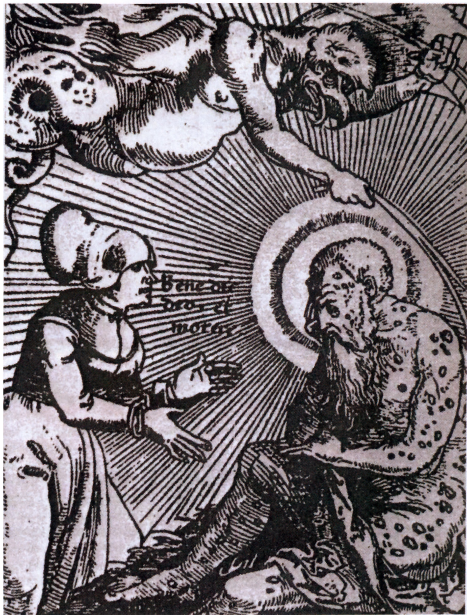
"Benedic deo et more" (Lovpris Gud og vær tålmodig!) Træsnit af Hans Wechtelin. Billedet fremstiller Satan, som pisker spedalskhed på Job. (Jobs bog 2,7).