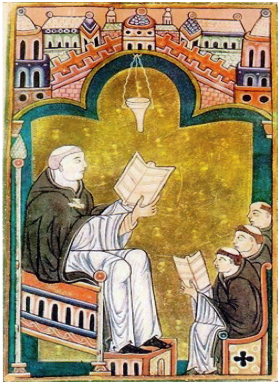
Hugo af Saint-Victor og hans skole.