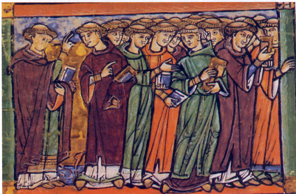
Miniaturemaleri af munke. (Fra Kjærsgaards Danmarkshistorie.)

Ordenen opstod, fordi der fremkom ønske om at højne det intellektuelle og moralske niveau hos de mange tusind præster, der ikke var munke. Det kunne være landsbypræster, præster ved kongers eller fyrsters kapeller, ved almindelige bykirker eller ved de store domkirker. Reformfolk foreslog, at