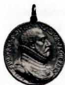
Medalje med Frederik 2. og dronning Sophies portrætter

Den lille sal var det rum i hovedgården, som var prydet af de fleste billeder, i alt 28. Mon ikke hovedstykkerne var de to