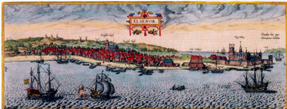
Helsingør år 1582 med Kronborg, toldboden, byen med Danske Kirke og Tyske Kirke og møllerne i baggrunden. Tegning af Hans von Knieper.

Indtil begyndelsen af det 17. århundrede hang der ikke megen billedkunst på danske vægge. Og slet ikke i borgerhjem. Det betød ikke, at stuerne var farveløse. Mange møbler var malede, oftest i rødt eller grønt, og ofte så gennemført, at man talte om en rød eller grøn stue. Der var kulørte hynder på bænke og stole, tæpper på borde og omhæng om himmelsenge. Og væggene kunne være smykkede med malede, mønstrede tapeter. Men billeder var der få af.