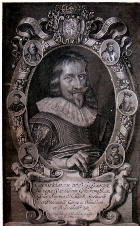
Christian 4. Fra indersiden af omslaget i den bibel der udkom 1633.

Antonimus, som var placeret ”wed Skorsteennen” regnes med her, måske blandt de kirkehistoriske. Fra nyere historie sås et billede af Hollands Triumf (søslag?). Desuden var der allegoriske billeder af våren og af menneskelivet (kobberstik). Endelig var der en lille rund tavle og fem kobberstik. Ingen af disse med angivelse af motiv. I alt var der 21 billeder i salen, som uden tvivl også med andre rum i boligen har været prydet med paneler og drætter (mønstrede tapeter).