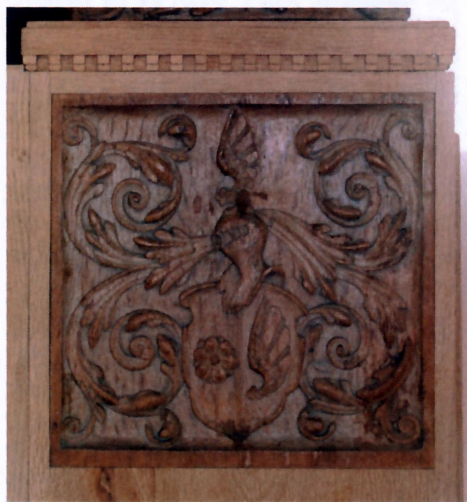
Familien Rosenvinges våbenskjold fra deres stol i Skt. Olai Kirke.