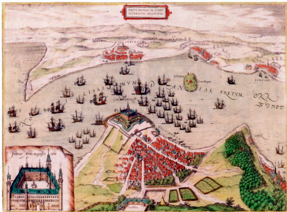
Prospektet viser øresundbyerne og den store trafik i Sundet omkring 1590. Dominerende i billedet er Frederik 2.s prægtige Kronborg. Fra Braun og Hogenberg, Verdens Byer.