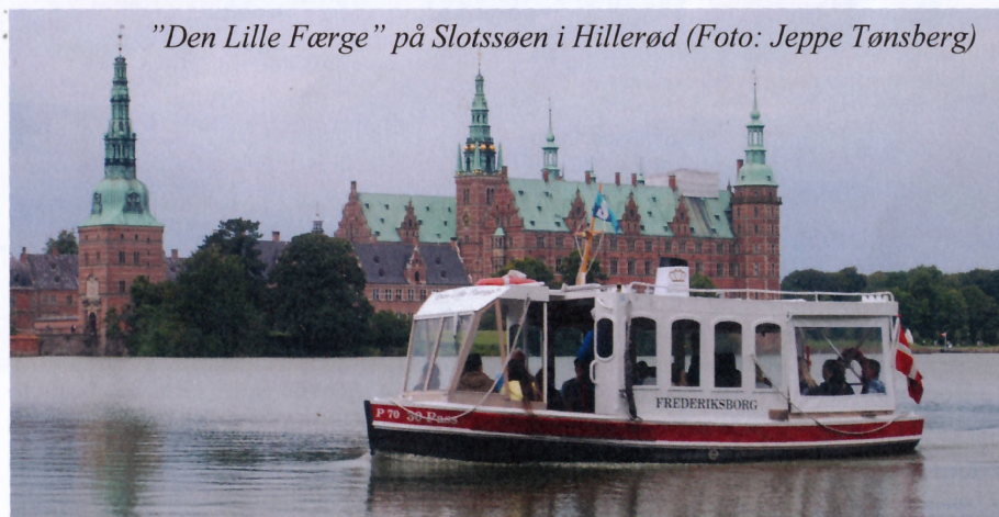
"Den Lille Færge" på Slotssøen i Hillerød

når man ser nærmere på dens skrog. Båden er egentlig tegnet som redningsbåd til motorskibet "Jutlandia" i 1950, men da "Jutlandia" skulle bruges som hospitalsskib, blev der brug for større redningsbåde. Tegningen blev derfor kun anvendt til denne ene båd, der blev bestilt og bygget til sin nuværende anvendelse på Helgoland Værft i Helsingør. Om vinteren opbevares båden indendørs.