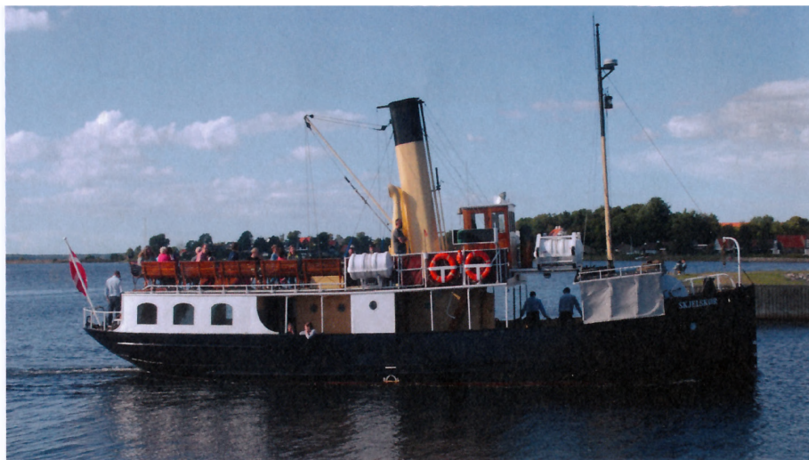
"S/S Skjelskør" på Roskilde Fjord

På Roskilde Fjord sejler "Foreningen til Gamle Skibes Bevarelse" med det lille dampskib S/S "Skjelskør" fra 1914. Skibet blev bygget i Svendborg til at sejle på ruterne fra Skælskør til Omø og Agersø. Da den kortere sejlads til øerne fra Stignæs begyndte i 1962 med nye færger, blev "Skjelskør" solgt til ophugning, men blev i sidste øjeblik reddet af den nystiftede forening. Skibet, der må medtage 80 passagerer, sejler ture fra Frederikssund på en times varighed om søndagen i sommersæsonen, desuden længere ture torsdag aften. Skibet kommer på værft i Gilleleje om efteråret, men ligger ved kaj i Frederikssund om vinteren.