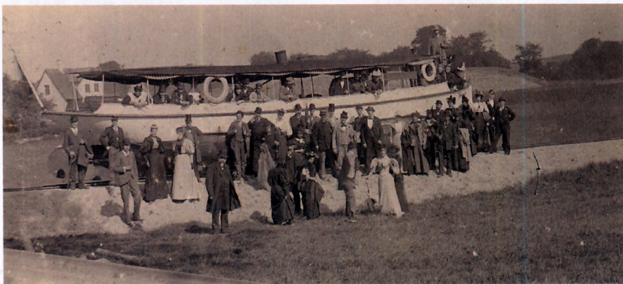
Amfibiebåden "Svanen" kører på skinner fra Farum Sø til Furesøen ca. 1895. Som det ses på billedet, havde den særprægede "sejlads" langt flere tilskuere end passagerer og blev derfor opgivet i 1898.

Kanalsystemet i Københavns Fæstning var inddelt i sektioner mellem stemmeværker (sluser), der regulerede vandets fald mellem de enkelte oversvømmelsesbassiner fra Furesøens til Øresunds vandoverflade, i alt en forskel på 20 meter. Bådene kunne naturligvis ikke sejle igennem stemmeværkerne, med mindre disse blev omdannet til kammersluser; men man kunne som en billigere løsning sætte hjul på bådene og trække dem på skinner rundt om opstemningerne.