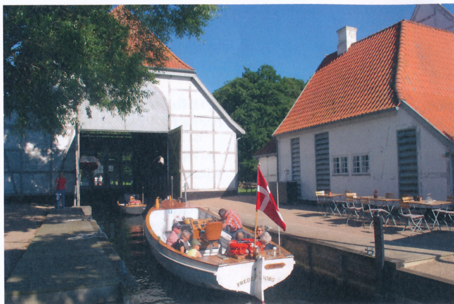
"Viking" på Esrum Sø ved Skipperhuset

bådehus fra 1726 med et bassin i midten er stadig i brug, og her ligger de to passagerbåde fortøjet. Bådehuset var fra begyndelsen bygget med meget høj tagrejsning og en høj port i gavlen ud til søen, så Frederik den Fjerdes lyst-yacht kunne sejle ind uden at lægge masten ned. I gavlen mod land var der en åbning svarende til porten, så man kunne se skibet ligge derinde med søen som baggrund. Senere blev bådehuset ombygget til anden brug, men står i dag restaureret og ført tilbage til sin oprindelige skikkelse. Nu er bassinet dog støbt i beton med mulighed for at aflukkes med en flytbar spunsvæg og tømmes for vand som en tørdok. Her står "Viking" på bunden om vinteren, indendørs og tørt, medens den mindre