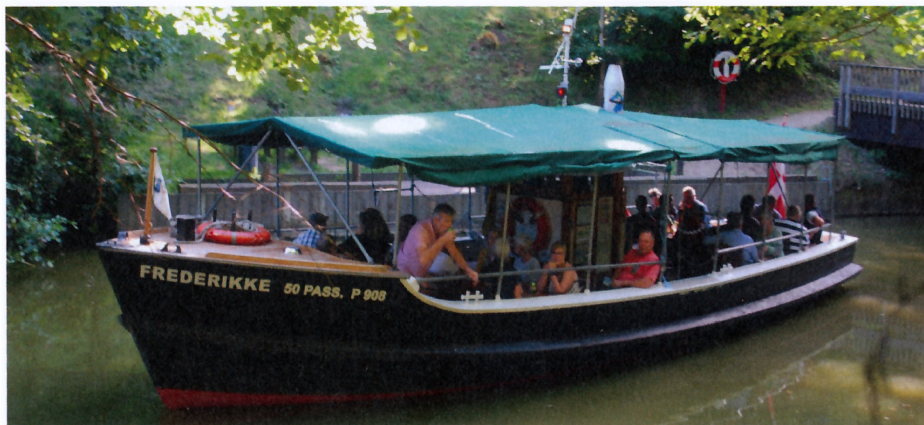
"Frederikke" på Arresø i kanalen ved Frederiksværk

land i Auderød Havn på nordspidsen af næsset, der rager ud i Arresø sydfra.