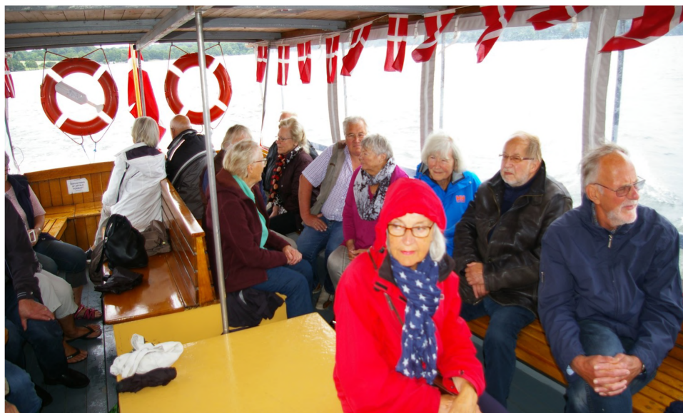
Foreningens udflugt d. 24. maj med sejltur på Furesøen startede i øsende regnvejr, men båden var heldigvis overdækket. Og regnen holdt op under sejladsen.