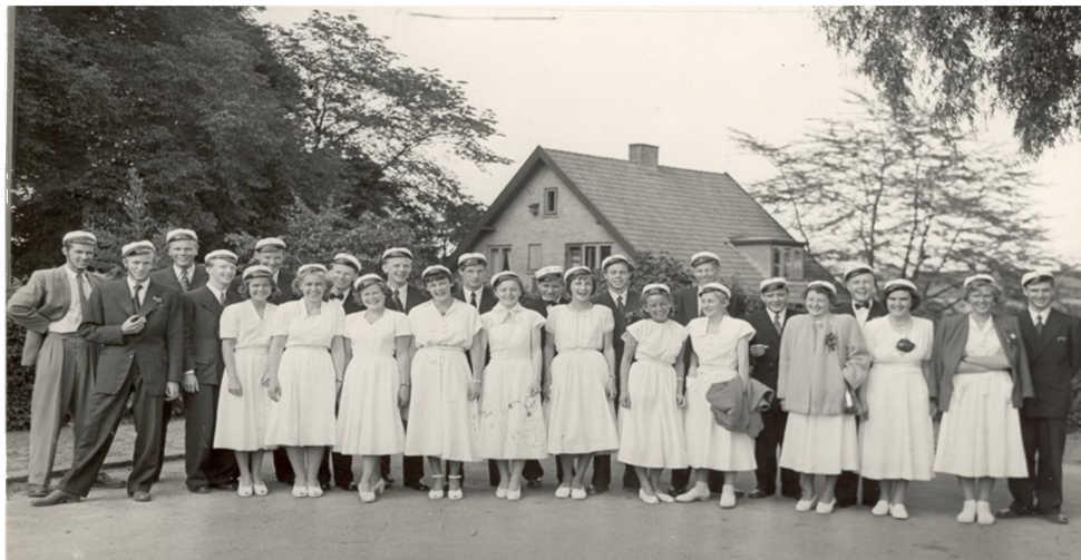
Studerer årgang 1951 fra Helsingør Gymnasium

Bag efter var vi i Chamonix og så bjerge for første gang. Vi boede på stor sovesal (2 sovesale) på et vandrehjem lige, hvor Mont Blanch tunnelen er i fag. Vi gik i bjergene hver dag fra morgen til aften. Efter Chamonix blev læreren i Frankrig, medens vi tog alene hjem over Martigny og Basel. Det var en stor oplevelse.